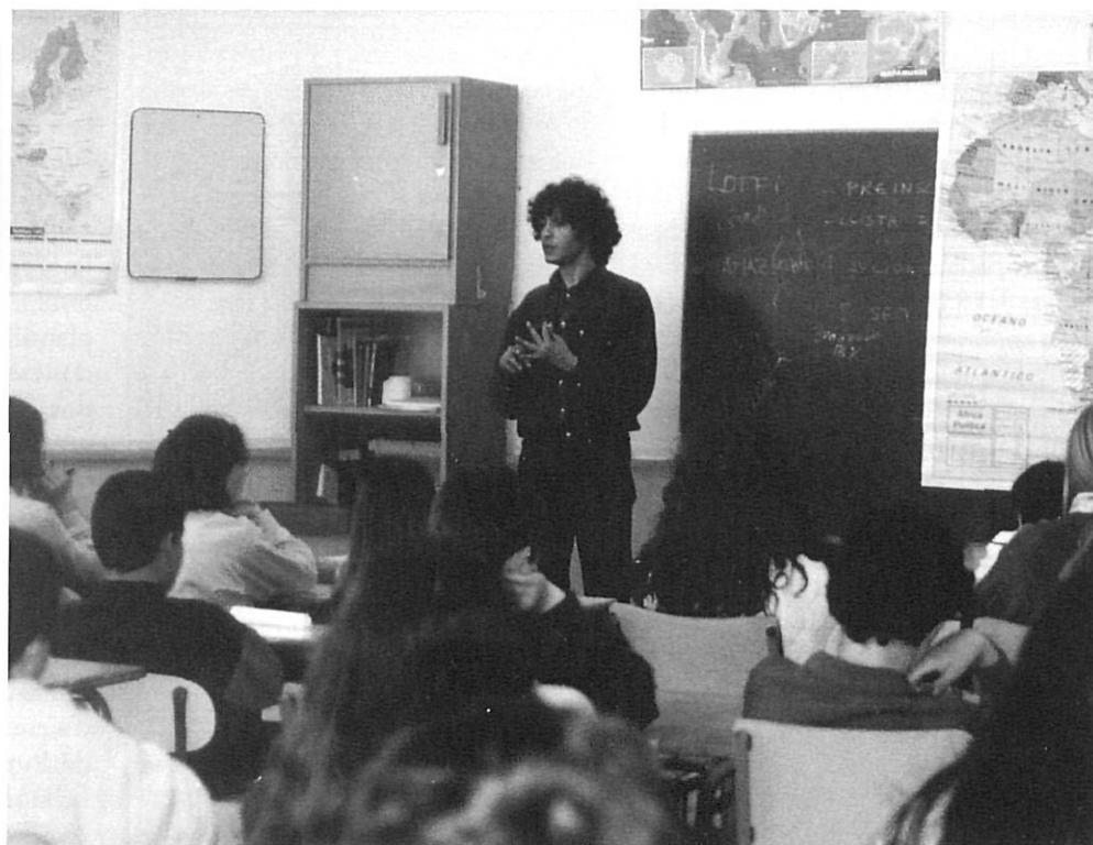
La proposta educativa "Coneguem el Marroc", a l'escola Anicet de Pagès, de Figueres.