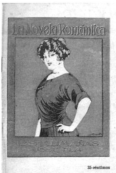
«Las alimañas», de Josep Pla (1922)

sional) amb els estaments oficials de la Dictadura de Primo de Rivera. En un àlbum sobre les comarques gironines, en l'apartat dedicat a Sant Joan de les Abadesses, redactat probablement pel mateix Artur Gas, es certificava solemnement, amb el mateix estil inflat que caracteritzava les seves antigues iniciatives editorials, la transformació de «la villa, que permanecía en un estado de sopor y de inactividad morbosa desde algunos lustros que la vieja política mangoneaba su administración». S'hi notificava la intervenció decisiva «del espíritu altamente patriótico del señor Gas, y sus cualidades poco comunes para la administración de los municipios modernos», i l'escrit es complaïa a afirmar: «Feliz el pueblo que al frente de sus destinos tiene hombres probos e inteligentes, y que todas sus actividades las emplean para el engrandecimiento y prosperidad de sus conciudadanos!»(11).