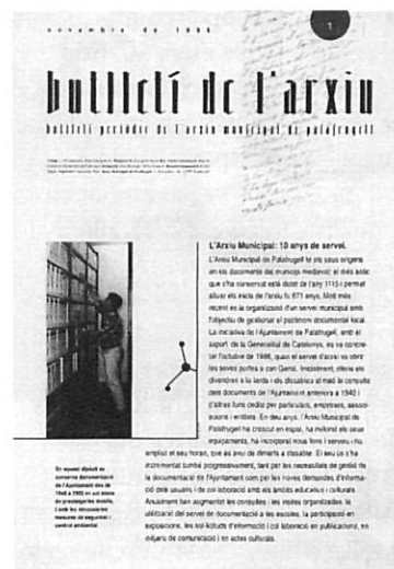
El butlletí de l'Arxiu es distribuirà amb el butlletí municipal «Can Bech».

L'inici el situem l'any 1986, quan l'Ajuntament de Palafrugell i la Generalitat varen signar un conveni de col·laboració i l'Arxiu Històric de Palafrugell va obrir les seves portes als locals de can Genís, antiga fàbrica de suro i actual seu de serveis municipals. Els objectius de treball eren recollir, organitzar i difondre la documentació de l'Ajuntament anterior a 1940 i els fons locals cedits considerats d'interès històric. L'horari inicial d'atenció al públic era el divendres a la tarda i el dissabte al matí, i el volum de documentació a organitzar, d'uns 300 m lineals. En la primera memòria de funcionament del servei consten 3 cessions de documents i l'atenció de 24 consultes.