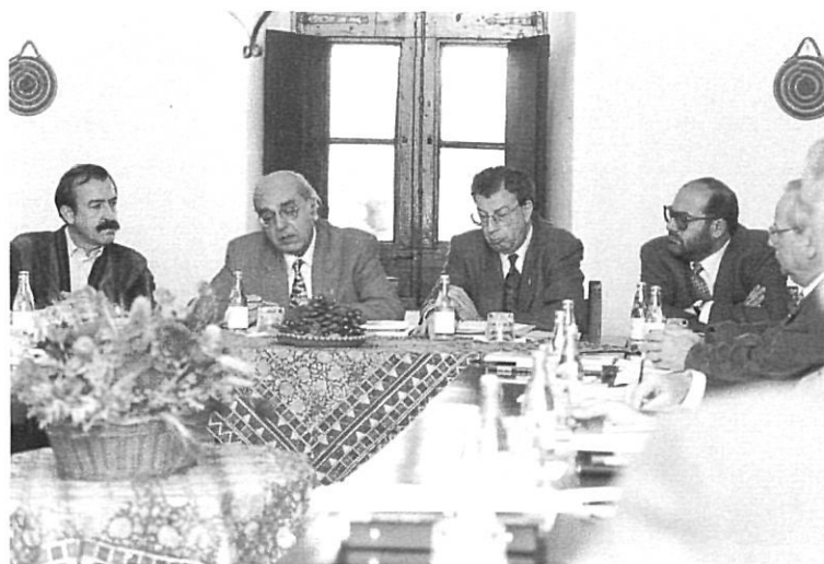
La taula presidencial.