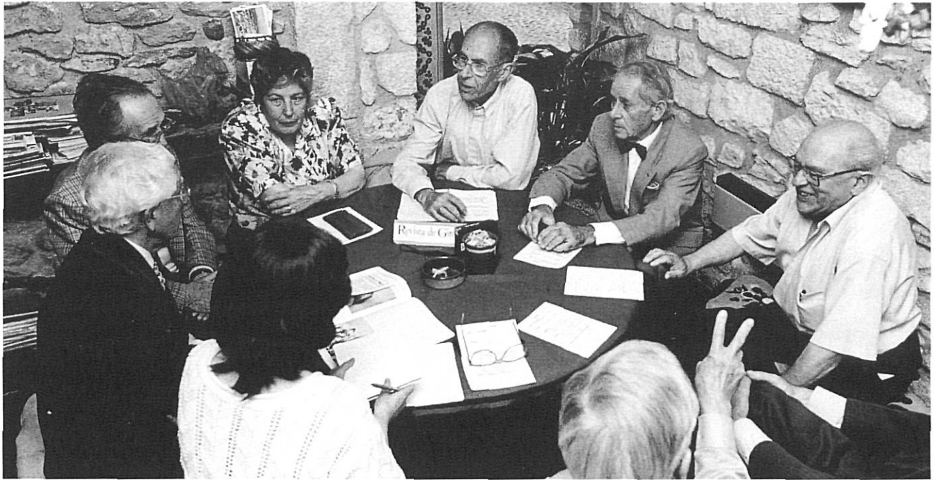
Els deixebles d'Aguilera, avui.

B.J. –Devia ser el 1932. Es feia classe de model nu a casa l'Aguilera, a la nit, i per a alumnes ja preparats. Amb mi venien en Pep Colomer, en Fiol, en Pere, en Gallostra i d'altres.