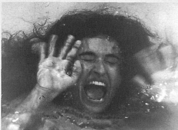
«Panteix» de Lluís Valentí.

Documental etnogràfic localitzat entre els municipis de La Merindad a La Somoza, territori situat al nord-oest de la Meseta Central espanyola, on encara l'ocupen les darreres poblacions d'origen celta que estan establerts en la Sierra de Ancares, a dos mil metres d'altura. El tipus de vida d'aquesta societat manté arrels dels antics costums neolítics. Actualment, part de la població de La Somoza,