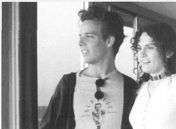
«Mientras brille el sol» de Joan Guinard.

Igual que Malena , Vogue no es va poder projectar l'anterior edició i, per tant, aquest any està inclosa en la secció d'exhibició.