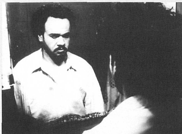
«Ave Fénix» de Marcelo Schwartz.

Dos homes i una dona, entre mig d'entendriores passions; de fons música, foc i dansa.