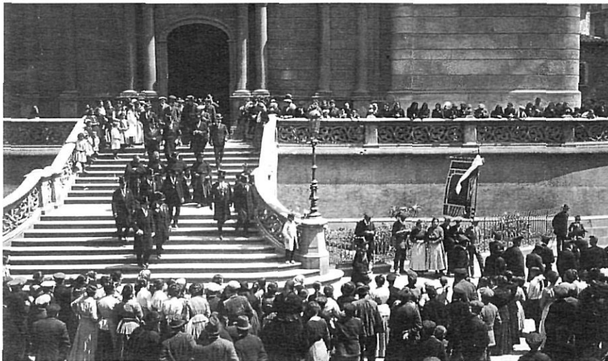
Davant l'església parroquial de Sant Esteve d'Olot.