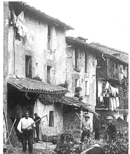
Hostalets de Bas.

D'aquesta llista es pot deduir clarament que l'element propietari és el més nombrós (quadre II). No es podia esperar altra cosa. També de la profusió de presonal inclòs a la llista principalment per ésser càrrecs municipals, mestres o professionals que podien tenir més o menys influència en la comunitat. La resta, composta per un variat reguitzell de botiguers, artesans i pagesos formarien l'element base d'una possible futura militància. No cal oblidar que la