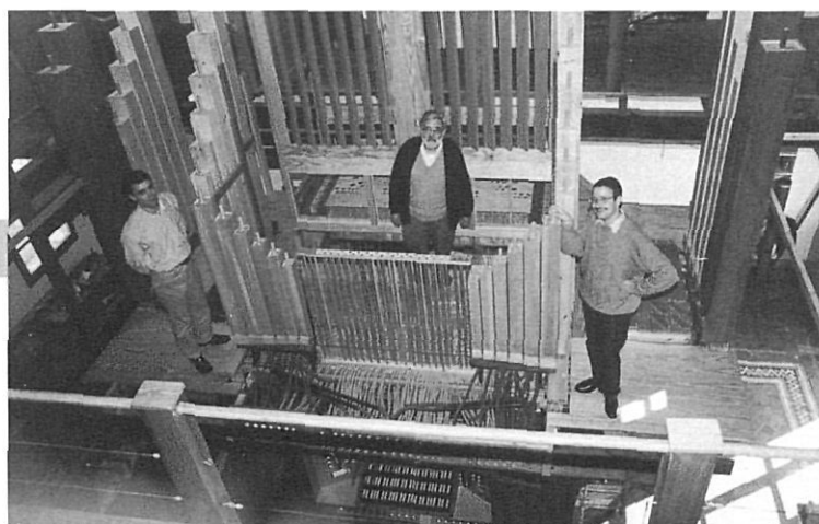
L'orgue de Puigcerdà vist per dins.

Collbató fins a la parròquia de Puigcerdà, i vaig posar les mans damunt els seus tres teclats. Solament l'he sentit, una vegada acabat, el dia de la inauguració.