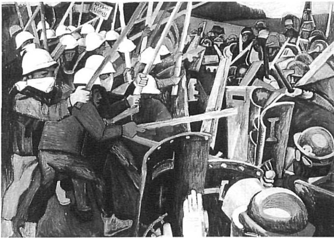
A dalt, "Paolo Uccello 1968", 1969. A baix, "Soldat vietnamita", 1965.

Com et deia al començament, el mateix ens va fer saber que la seva obra havia