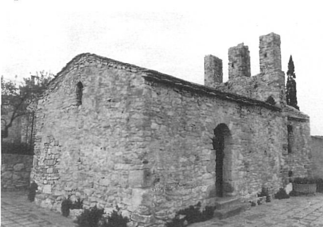
Església de Sant Julià de Boada.