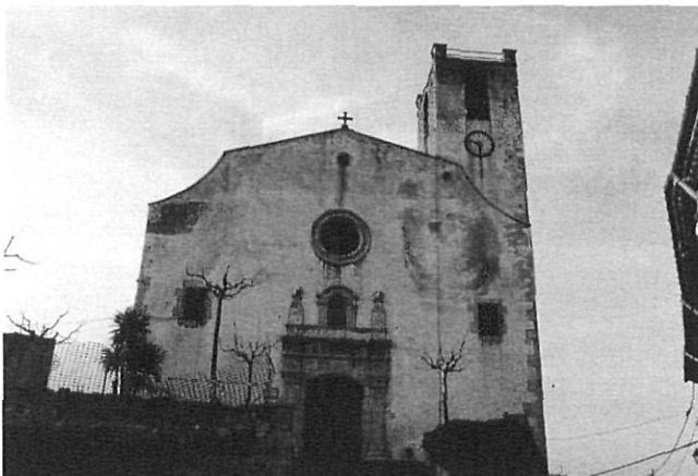
Església de Gualta.