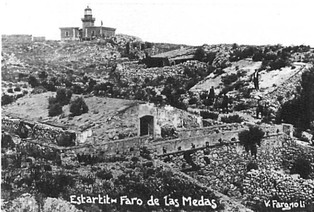
Estartit - Faro de las Medas