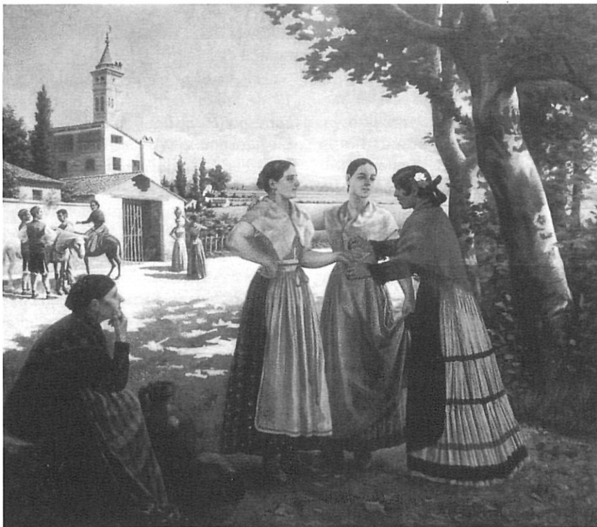
Dones de l'Aragó. N. Casadevall, 1894. Oli sobre tela; 199 x 230 cm. MD'A de Girona. En aquesta pintura es veu un domini de l'artista tant de l'anatomia humana com del paisatge, amb un conseguit contrast de llum i ombra.

Pocs dies després es reuneixen els vocals membres del tribunal, els quals de segur que examinen les dues instàncies presentades, les de Domenge i Casadevall de 19 i 18 anys respectivament, i veuen que la modificació de l'esborrany inicial consistent a admetre joves fins a 25 anys no va ser encertada. Així, els quatre vocals escriuen el 5 de novembre a la Diputació proposant que es prorrogui l'edat dels aspirants fins «complets els 30 anys». Opinen que, exceptuant casos d'extraordinària aptitud, són pocs els joves que abans d'aquesta edat poden aprofitar adequadament l'ensenyament que rebran a les acadèmies de París i Roma.