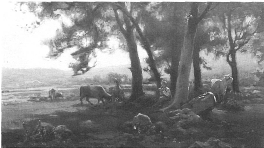
Sense títol. M. Domenge, 1902. Oli sobre tela; 64 x 111 cm. M.C.G. d'Olot. Tradicional temàtica del pintor, amb figures bucòliques de pastors i ramats entre rierols i rowredes de les valls d'Olot.

Però si bé les coses sembla que van ràpides al començament després tot plegat s'alenteix, ja que no hi ha gaires notícies a remarcar fins nou mesos després, el 27 de febrer de 1891, en què es posa de manifest el paper predominant de Joaquim Vayreda, que es pronuncia sobre l'esborrany de la