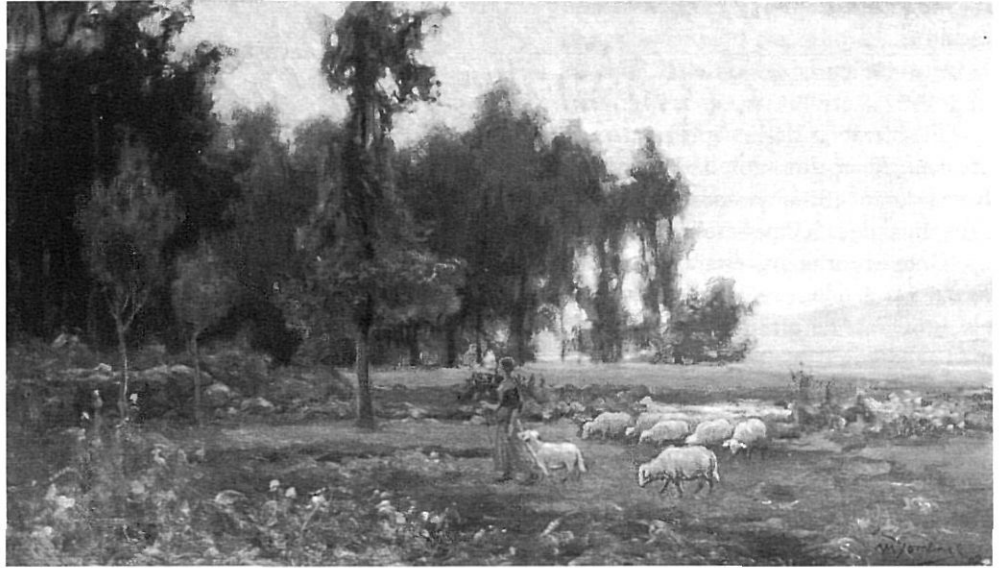
Sense títol. M. Domenge, 1902. Oli sobre tela; 64'5 x 112 cm. M.C.G. d'Olot. El tema de la pastora amb el ramat de xais és molt freqüent en l'autor, que canvia sovint la figura per una de masculina, i converteix així el tema en una pintura religiosa del Bon Pastor.