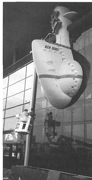
Submarí de reclam en un restaurant del Maremagnum.

El 28 de juny de 1856 Narcís Monturiol avarà l'Ictineu al port de Barcelona per realitzar les primeres proves de la navegació submarina. Durant molt temps s'havia dit que la ciutat cap i casal vivia d'esquenes a la seva façana litoral. Darrerament, Barcelona ha remodelat el seu front litoral i ha potenciat l'oferta lúdica i de serveis dels molls de la Fusta i el Port Vell. Entre d'altres exemples, destaca la modernització del Museu Marítim, la creació de l'Aquàrium, el més exhaustiu del món en temàtica mediterrània i el recentment inaugurat Museu d'Història de Catalunya. Val a dir que en alguns d'aquests equipaments, i en altres llocs de la ciutat, es fa ressò de l'enginy creatiu i la tenacitat del figuerenc Narcís Monturiol.