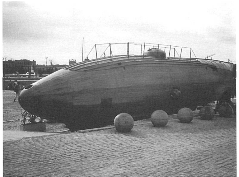
Rèplica de l'Ictineu II davant de l'Imax, al Port Vell.

Rodanxa interactiva de l'Ictineu al Museu d'Història de Catalunya.