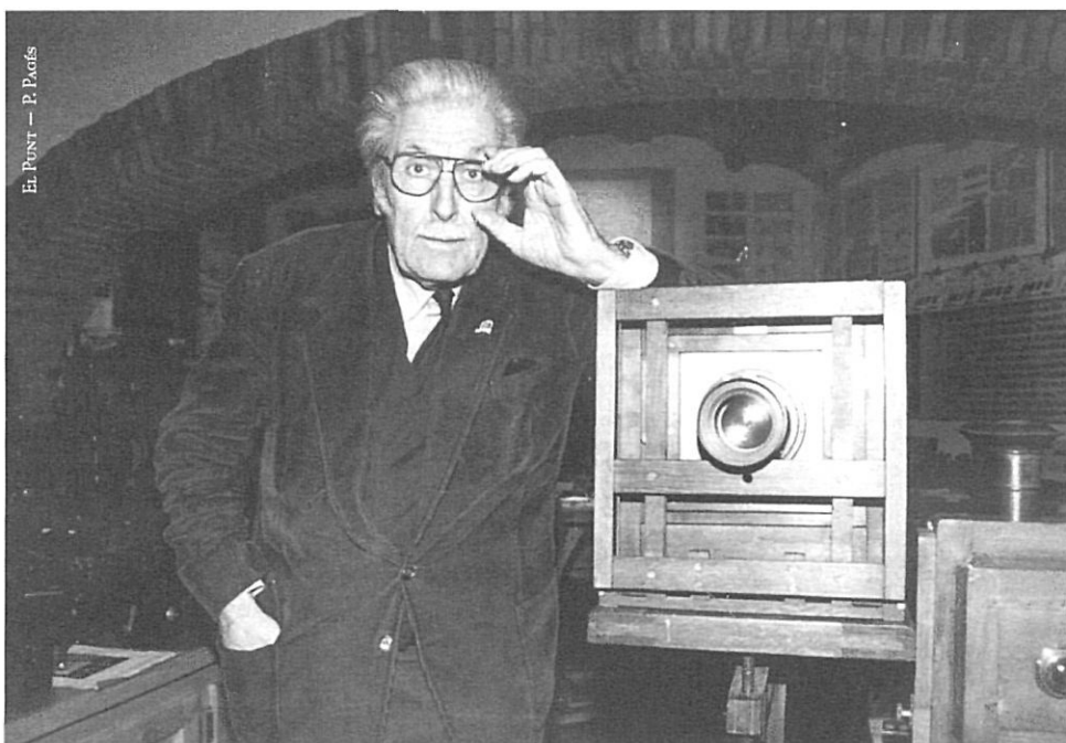
El Pont — P. Padés

mica com el Museu de la Ciència de Barcelona, que t'ensenya coses que no aprendries d'una altra manera. El Museu del Cinema ha de complaure tant l'espectador del carrer com l'estudiós i l'expert». A més, Mallol creu que el museu ha de tenir ofertes prou variades i canviants com perquè l'espectador repeteixi la seva visita. «S'ha de procurar fer prou activitats per convidar el visitant que vingui no només una vegada, sinó tres o quatre. Si tothom hi anés una sola vegada, suposant que de l'àrea de Girona hi anessin unes cent cinquanta mil persones, totes hi anirien el primer any, però el segon ja no hi aniria ningú».