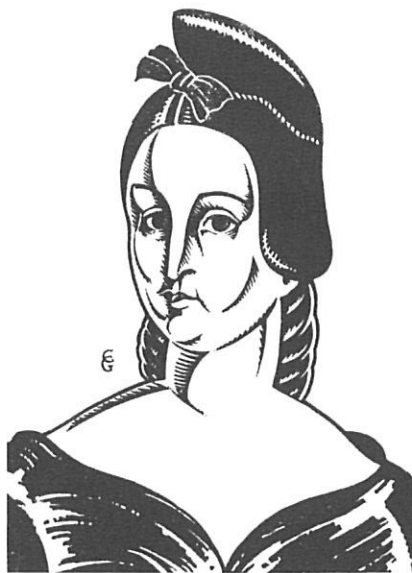
Mariana Pineda, símbol de la llibertat, en un dibuix signat per l'equip CG i publicat a L'Autonomista (1931).

Al número 18 (15 de gener de 1933) il·lustra l'article «L'atur forçós»,