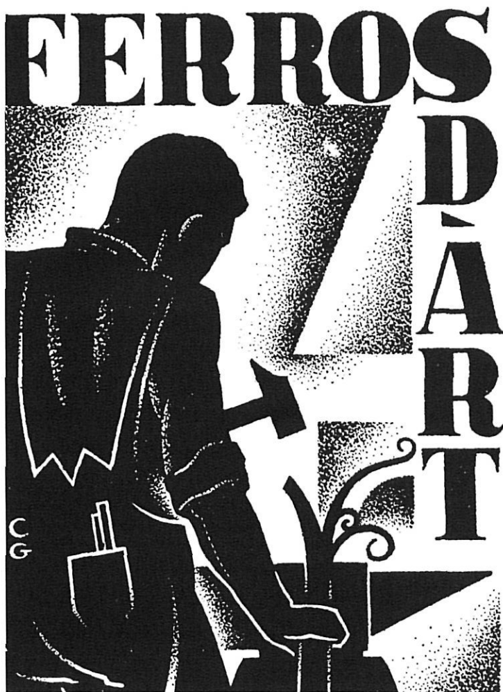
Un dels molts dibuixos publicitaris signats CG (Colomer-Gallostra), el 1935.