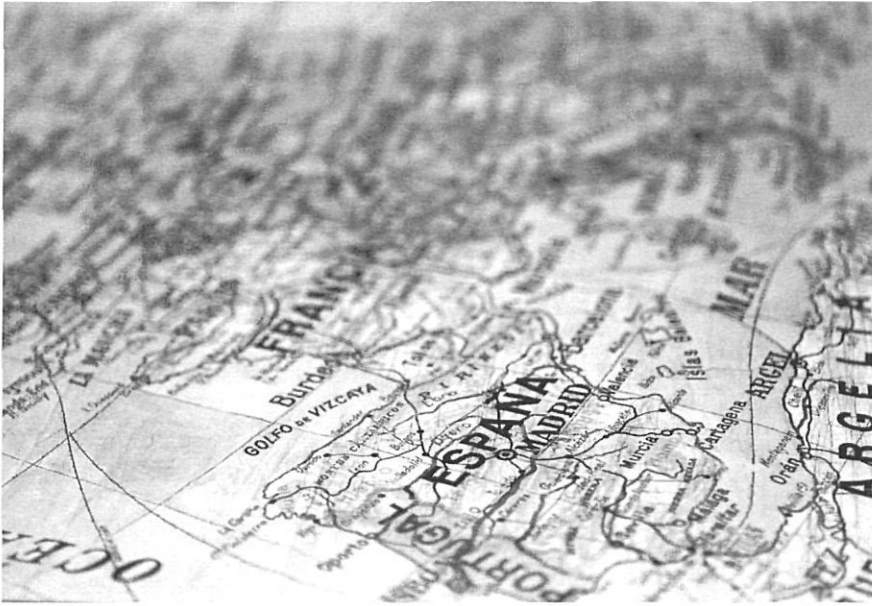
"Records il·luminats pels ocres de la nostàlgia".

sobre la carn, de la vella cultura i ara, en canvi, ja tothom estudia, i no m'acabo d'adaptar (ni jo ni els meus germans petits) a les ignotes exigències que el present em reclama.