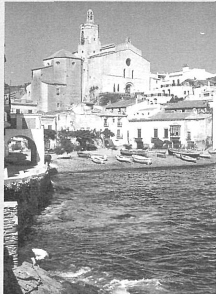
Un incipient turisme es va enamorar dels carrers de Cadaqués.