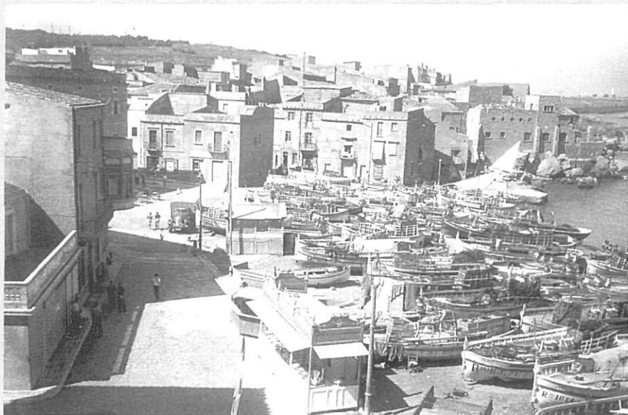
Les barques omplen el port de l'Escala.