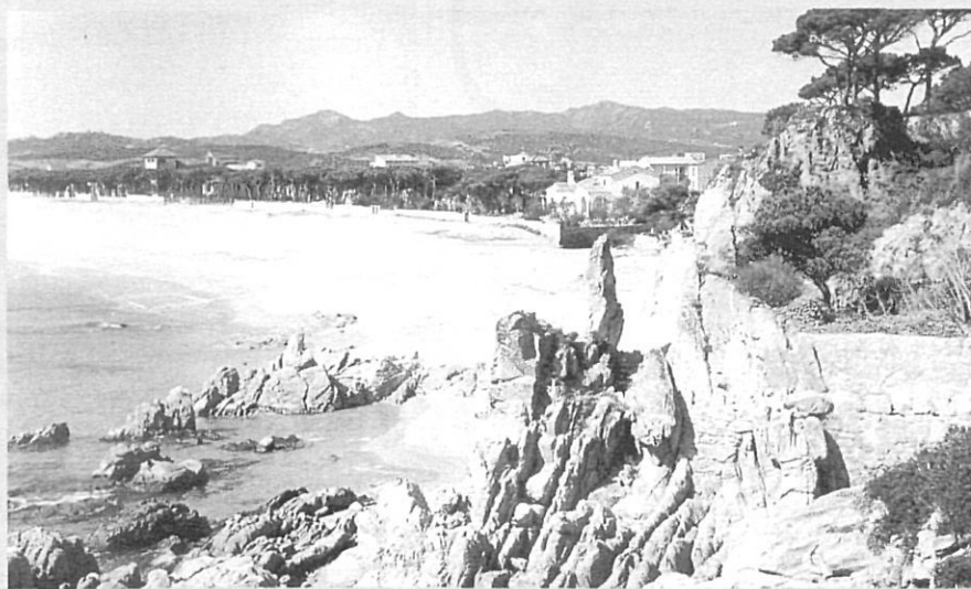
Les primeres cases d'estiuejants en mig de la pineda de Platja d'Aro.