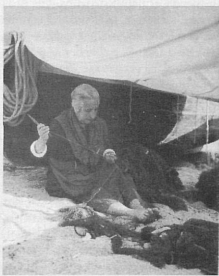
Granés va realitzar escassos retrats costumistes com aquest d'una pescadora.