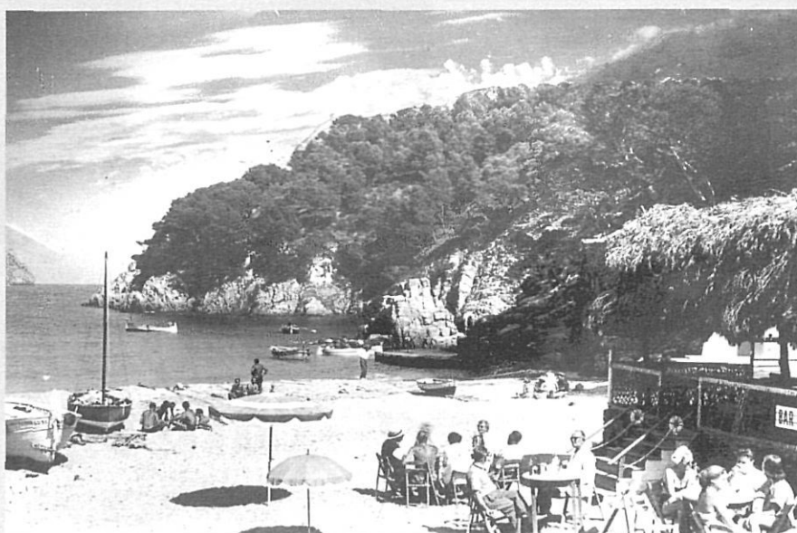
Estiuejants prenent el vermut al bar Garreta de la cala d'Aiguablava.