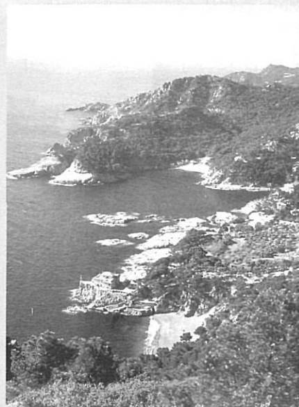
Vista general de la costa.