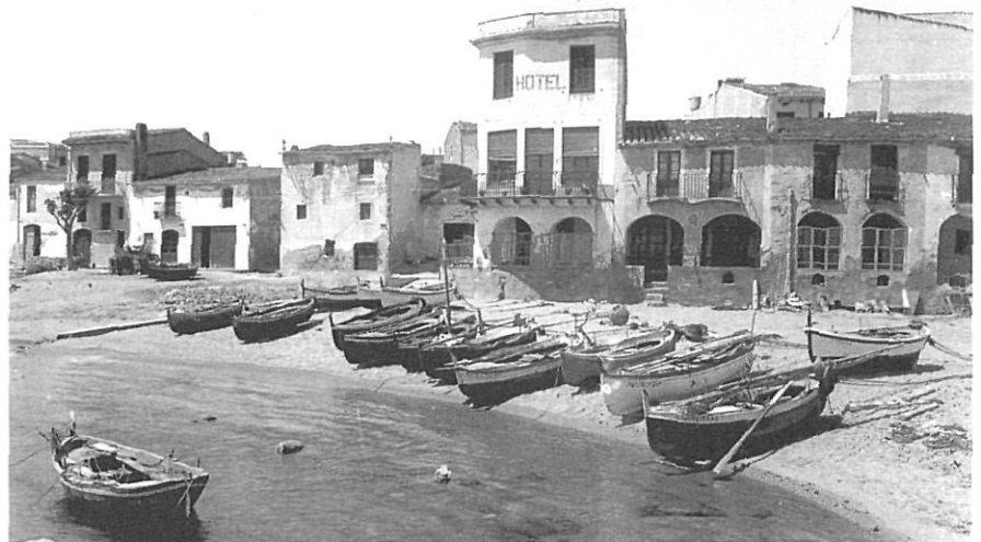
Calella abans del boom turístic.