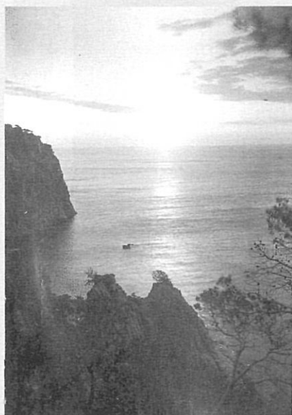
Postal de la Costa Brava amb el títol de «Amanecer en la Costa Brava».