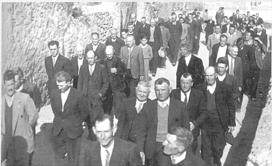
Una de les imatges de l'àlbum fotogràfic que recollia la Santa Missió de Jafre l'any 1947.