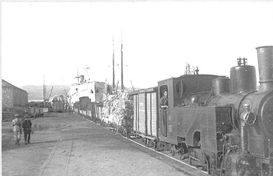
El carrilet carregant mercaderies al port de Palamós.