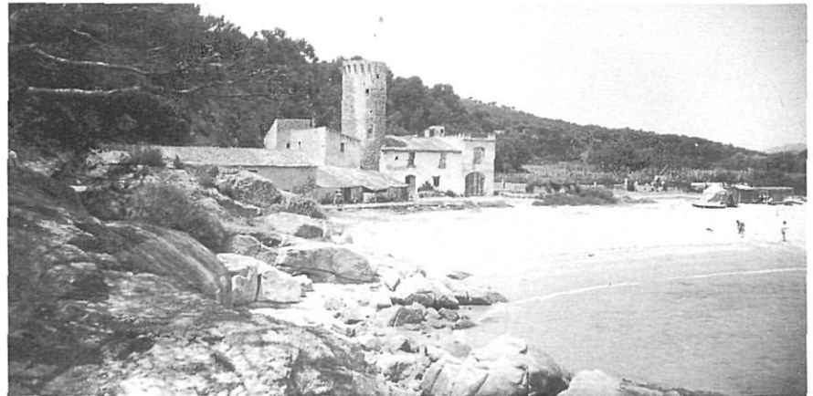
La sempre mítica Torre Valentina.