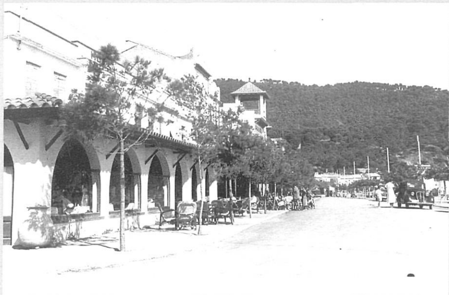
El bell paisatge i la tranquil·litat del lloc van fer de Llafranc un excel·lent lloc d'estiuieg.