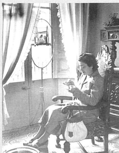
Posada en escena acurada per tal de realitzar el retrat.