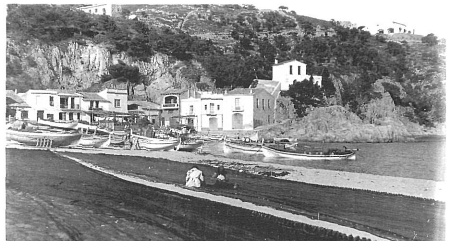
Xarxes esteses a Tamariu.