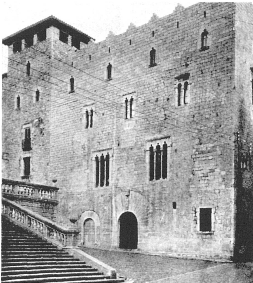
La Pia Almoïna de Girona, a la plaça de la Catedral.