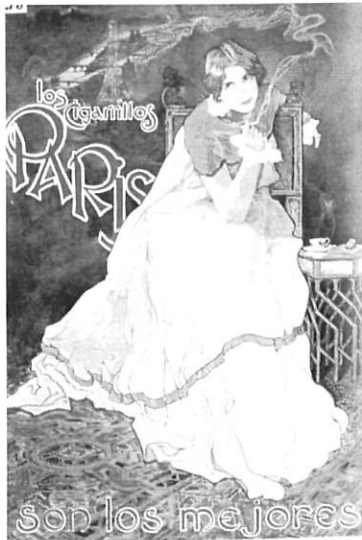
Alguns dels cent cartells aplegats a l'exposició d'Olot.