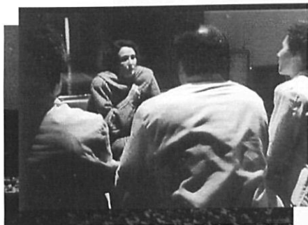
"Urgència zero", premi al millor film del Festival de Girona.