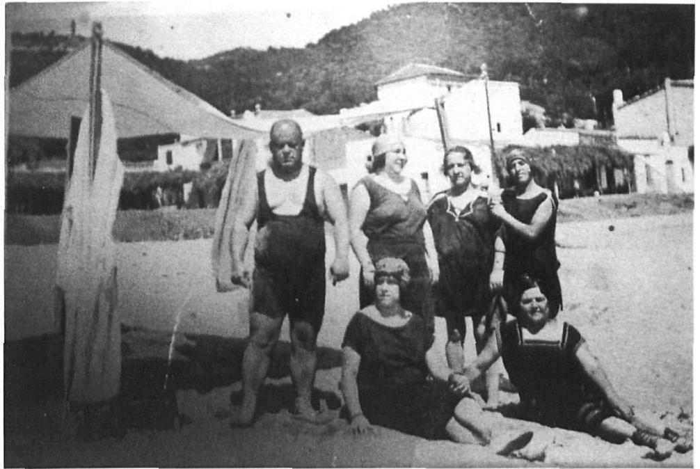
L'Estartit, primers turistes, 1920.