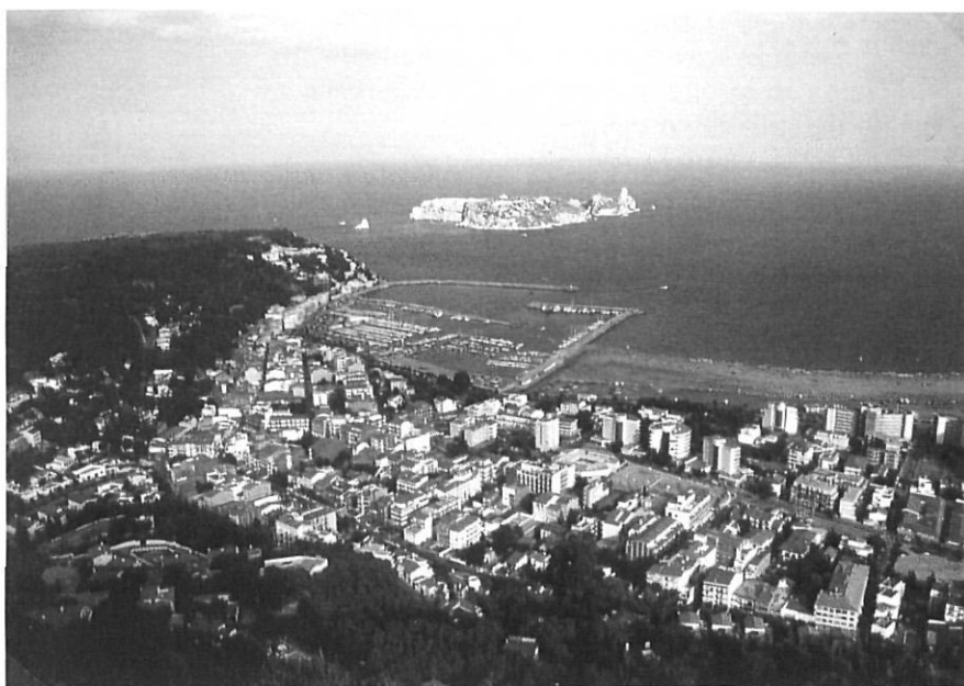
Panorama de l'Estartit i les Medes, 1994.

Si hem considerat el paisatge com un recurs més, caldrà aplicar-li també uns criteris de gestió, tenint sempre present que és un recurs més fràgil que la resta perquè un cop fet malbé la seva recuperació resulta molt costosa o impossible. No hem d'oblidar que va ser la qualitat estètica del paisatge de la Costa Brava el que va motivar la seva elecció com a destinació turística d'artistes com Marc Chagall, Salvador Dalí, Ava Gardner... i dels primers turistes, aquells que segons la teoria del cicle de vida van actuar com a exploradors d'unes destinacions que