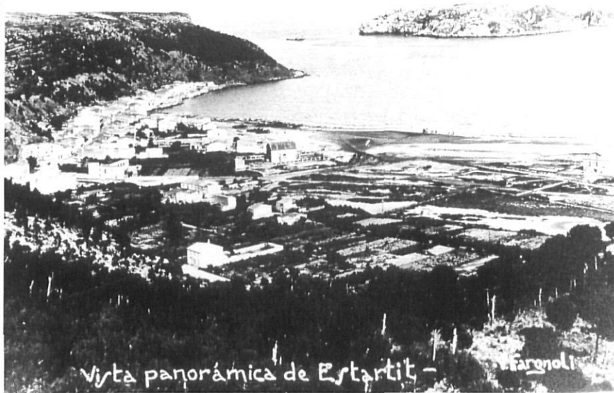
Panorama de l'Estartit i les Medes, anys 20.

mida dels seus mercats origen i el volum de turistes que hi arriben. És l'Etapa de Declivi en què la localitat només serà visitada els caps de setmana o en excursions d'un dia. Els hotels iniciaran la seva reconversió en residències de repòs per a la tercera edat o en apartaments. En última instància la localitat pot perdre fins i tot la seva funció turística. També és possible que en lloc d'un declivi, ens trobem amb una nova Etapa de Rejuveniment, en la qual només s'entraria després d'un canvi dels factors d'atracció sobre els quals s'havia fonamentat anteriorment el turisme. La trajectòria de la corba, un cop s'ha assolit el període d'estancament, dependrà de les mesures que es prenguin.