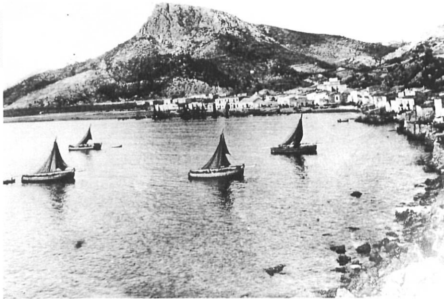
L'Estartit, vista general des del port actual, 1916

mics han liquidat el turisme a Algèria i fet disminuir sensiblement el d'Egipte. En definitiva, es pot dir que les nostres destinacions turístiques quasi no tenen competidors a la Mediterrània.