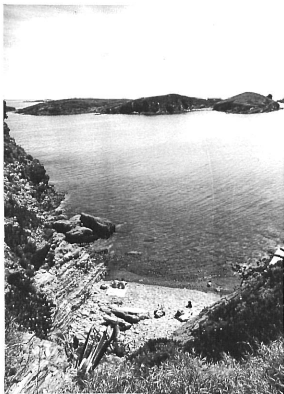
L'illa de Portlligat, tantes vegades present en l'obra pictòrica de Dalí.

Una vegada s'ha garantit el present cal pensar en el futur. Què es pot fer amb una illa? I amb l'illa de Portlligat? Una primera resposta seria dir el que no es pot o no s'ha de fer. És a dir, tancar encara que sigui amb la millora de les intencions, el que ha de romandre obert als ciutadans. La fàcil comunicació entre l'illa i la costa, uns pocs metres d'aigües baixes, permet fer tota mena de projectes d'enllaç. Després caldrà fer un procés de millora del conjunt. Els molts interrogants del seu futur ha fet que un dels indrets privilegiats de la Costa Brava nord sigui del domini dels darrers hippies d'aquest territori, ara sota la denominació d' okupes . En qualsevol cas és evident que les edificacions de l'illa de Portlligat s'han malmenat considerablement. Caldrà un informe tècnic per determinar el seu estat real.