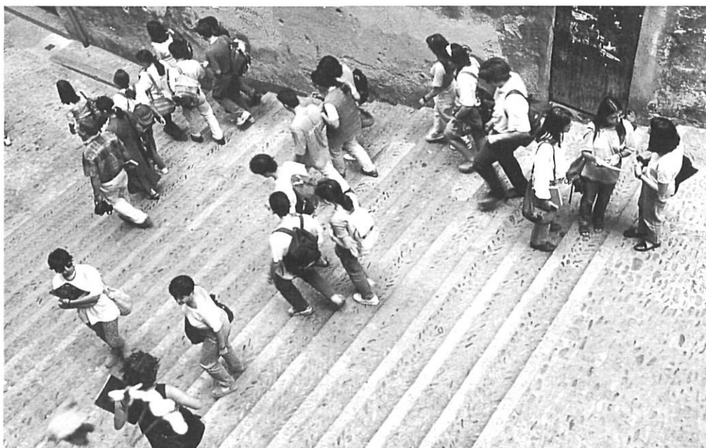
«El Consell d'Estudiants és l'òrgan que aplega els seus representants al Claustre de la Universitat de Girona»