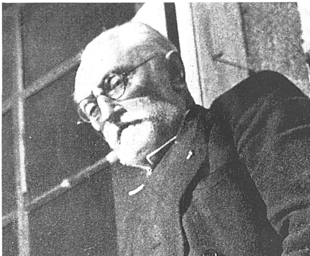
Entre 1898 i 1936, Miguel de Unamuno es va cartejar amb una quarantena de gironins