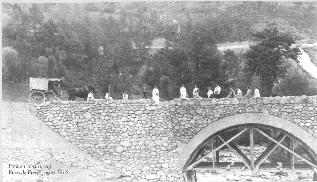
Pont en construcció. Ribes de Freser, agost 1915.