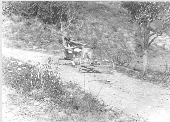
El noi de Can Batlló a tota màquina. Ribes de Freser, agost 1913.