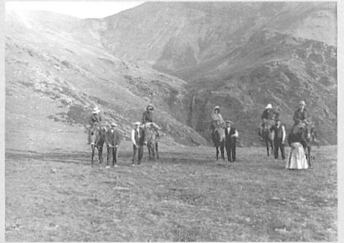
A cavall pel Pla de les Eugeses. Ribes de Freser, agost 1915.