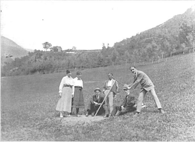
Escena campestre. Ribes de Freser, agost 1916.