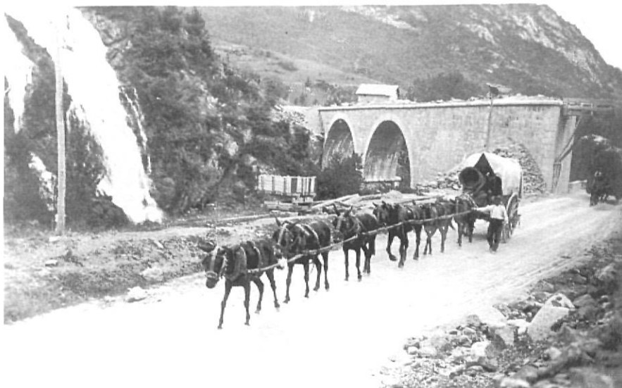
Carretera de Ribes a Ripoll, juliol 1915.