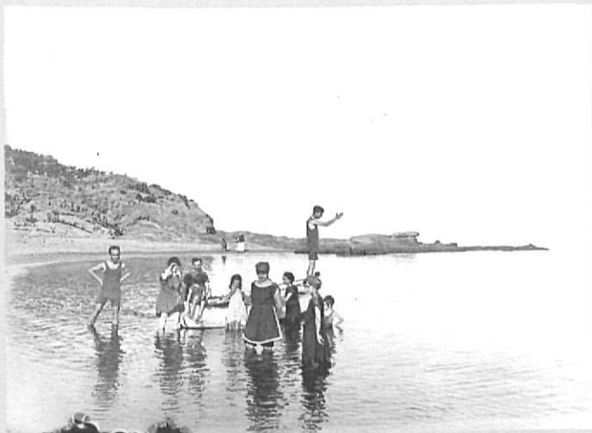
Bany a la platja de Grifeu. Llançà, agost 1918.