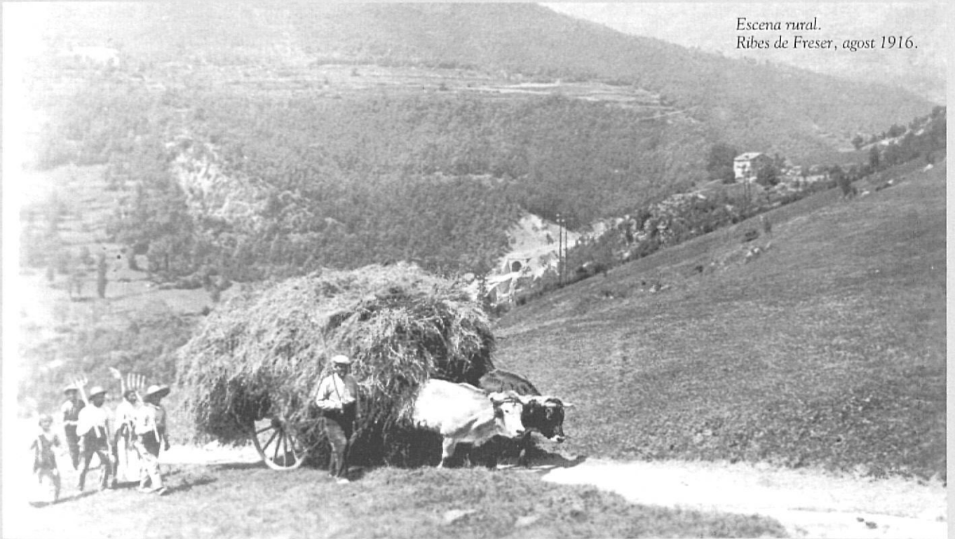
Escena rural. Ribes de Freser, agost 1916.