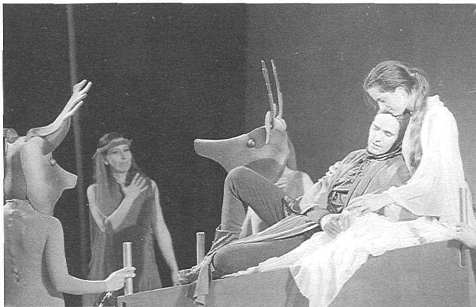
Escenes de la representació de Canigó a Figueres.

vuitanta-cinc anys. La burgesia figuerenca del moment es féu càrrec del mecenatge: Josep Carner transformaria l'èpica en tragèdia, Jaume Pahissa n'escriuria la partitura, Adrià Gual l'escenificaria a la plaça de toros, es comptà amb l'orquestra i el cos de ball del Liceu barceloní, els escenògrafs es traslladaren expressament al monestir del Canigó per ser fidedignes en els decorats, etc. Però el 3 de maig de 1910, data fixada per l'efemèride, un tramuntanal esquincà i s'endugué els 3.500 metres de tela que revestien el conjunt de l'escenari; s'hagué de suspendre l'estrena fins al 12 de juny: llavors més de tres mil persones aplaudiren l'èxit d'aquesta representació teatral, la primera que es feia a l'aire lliure a l'Estat. Ho celebraren amb un ball al Teatre Municipal i un refrigeri al Casino que s'allargà fins a la matinada, a l'hora que