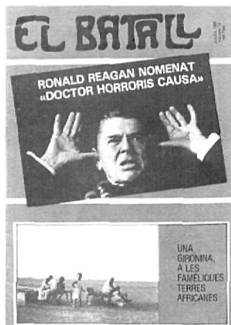
Portada d'El Batall, dissenyada per Enric Marquès (1985).

La part més coneguda d'aquesta col·laboració és a les seccions «Dietari cultural» i «Crònica», on va oferir cap a una vintena de comentaris d'actualitat que li permetien de valorar exposicions, artistes i museus, de glossar obres d'artistes consolidats i de remarcar les propostes innovadores més interessants.