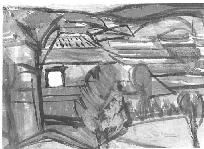
Una esquila abans de morir

humiliació i la ràbia de la postguerra gironina. I és, crec, una obra esplèndida, important. Espero que la ciutat de Girona sabrà fer el possible perquè aquesta obra no es dispersi més del que és convenient i perquè en part –una part representativa i ben triada– quedi exposada permanentment al Museu d'Història de la Ciutat. Per la seva vàlua intrínseca i per allò que històricament representa.