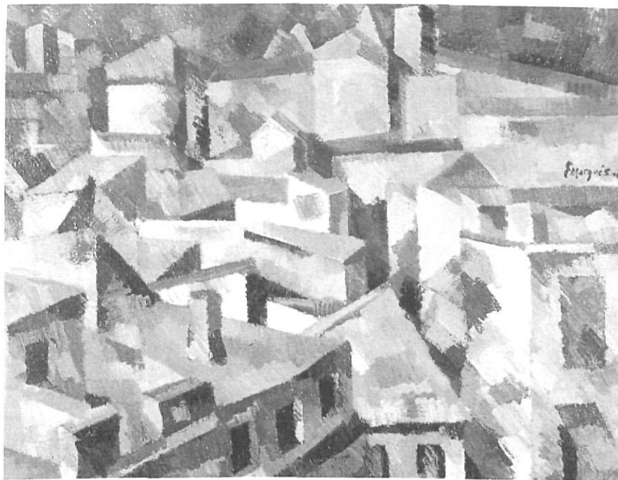
"Sant Martí Sacosta" (1953). A l'esquerra, "Camps de Sant Daniel" (1951).