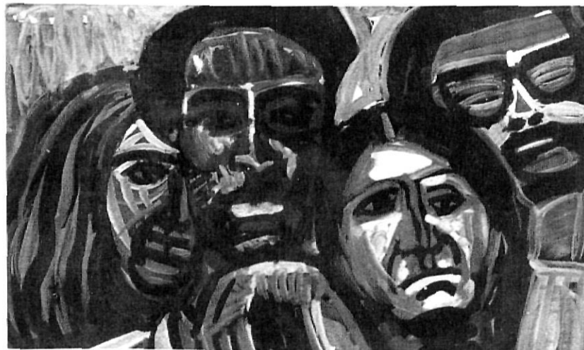
"EL somni americà".

en les pintures i les xilografies motivades per la guerra del Vietnam. El fet d'escollir per la seva protesta el terror i la humiliació de les víctimes més que no pas una idea abstracta va propiciar unes obres autèntiques de debò perquè, jo crec, era el terror i la humiliació de la seva infantesa allò que hi estava pintant. I, és clar, també va reeixir aquests anys en els temes de Girona i de paisatges, ara uns guaixos a vegades molt més grans, concebuts ja com a obra definitiva –més que no pas com a exercici, que és el cas de molts dels de la seva joventut. I hi va reeixir perquè la nostàlgia compensava la mala consciència que segurament tenia en pintar-los. De fet, en la meua visita del 1970, va dir-me, com excusant-se, davant de les pintures de Llagostera: «Es pot romandre insensible a l'atracció del paisatge quan la natura torna a disposar de tota la seva sensualitat?».