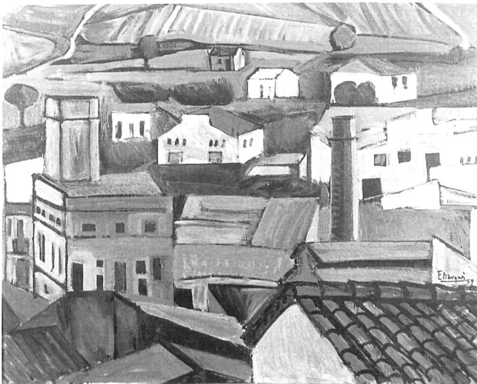
"Paisatge de Llagostera" (1960).