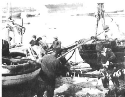
Els antics magatzems del Tinglado, al moll vell de Palamós: una possibilitat perduda de reinserció museística.

despietats actuals. Però, què passa quan la paraula «salvació» és sinònim «d'enclaustració», «segrest» o bé «empresonament»? Segons les teories sobre les condicions que han sorgit de la mateixa vida, necessiten, com les persones, del seu espai peculiar i del seu temps propi per a viure, viure i viure. D'aquesta manera ja són molts els directors de museu que es comencen a estirar els cabells, sobretot els més melenuts , quan s'adonen que s'han convertit en magnífics directors de presons de la cultura. De forma indiscriminada, innocents objectes de conegudíssim valor s'han trobat engarjolats darrera dels barrots dels museus sense altre delictes que pertànyer a una tradició d'un espai i un temps que és ben diferent del nostre. I ara no voldria sermonejar en definicions sobre l'espai i el temps, com tampoc entrar en el problemàtic tema de la validesa de les presons, perquè aquest ni és el moment ni el lloc adequat; sinó més aviat m'agradaria comentar la situació actual gironina i fer-me ressò d'algunes veus molt puntuals a favor de la reinserció.