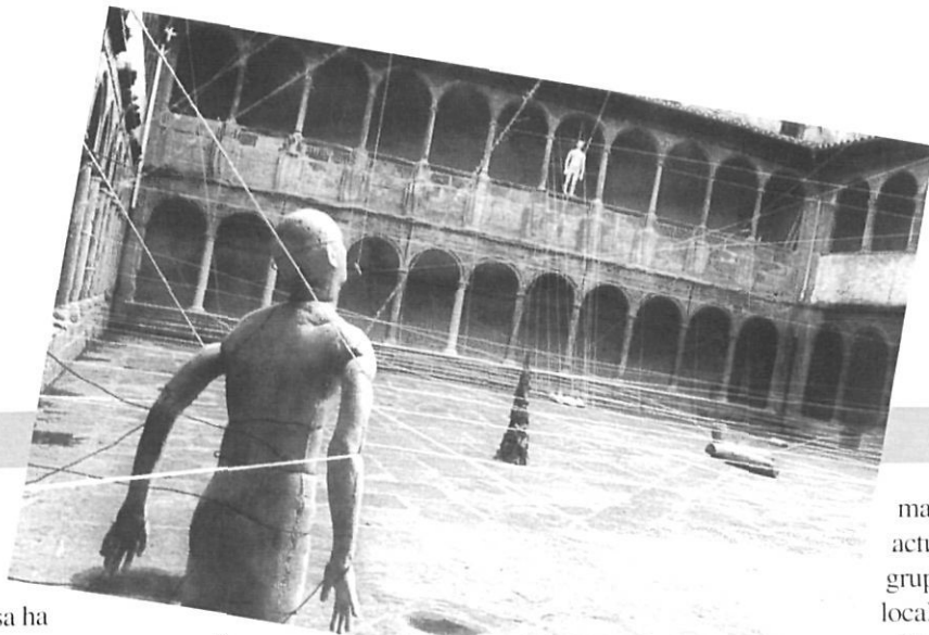
Dues escenificacions al Fòrum de Teatre d'Olot, 1994

No voldria ara treure importància al Fòrum per donar-la al TPO (Teatre Principal d'Olot), però una cosa ha d'anar estretament lligada a l'altra: és ben cert que les millors possibilitats que els molins tenim d'anar a teatre les ofereix el Fòrum, mentre que la resta de programació teatral d'Olot —que s'ha de dur a terme des del TPO— és cada vegada més ínfima. Va desaparèixer l'associació d'espectadors i ara costarà molt refer-la si és que es vol, que ja dubto que algú sàpiga exactament què es vol. És clar, doncs, que l'únic focus clar a l'escena és el Fòrum i si no es potència podria apagar-se també. Però aquesta potenciació ha de passar també per una empenta atrevida i definitiva a la Fundació del TPO.