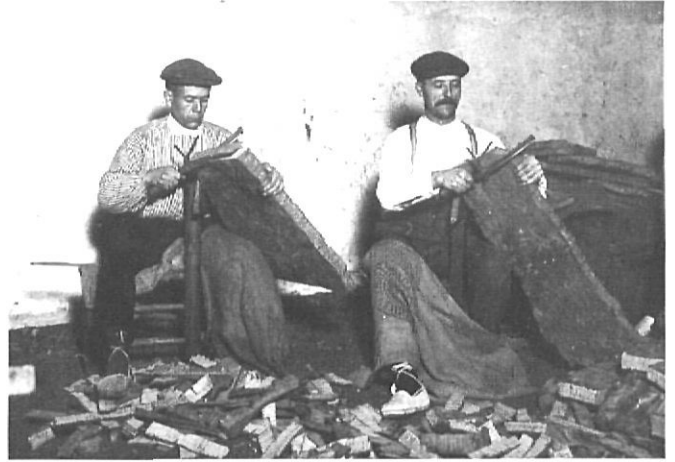
Elaborant el suro.