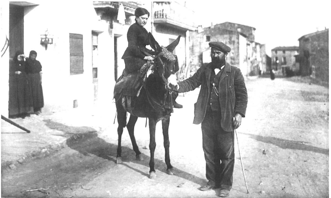
Retrat de personatges. A sota, fabricació de teules i taps de suro.