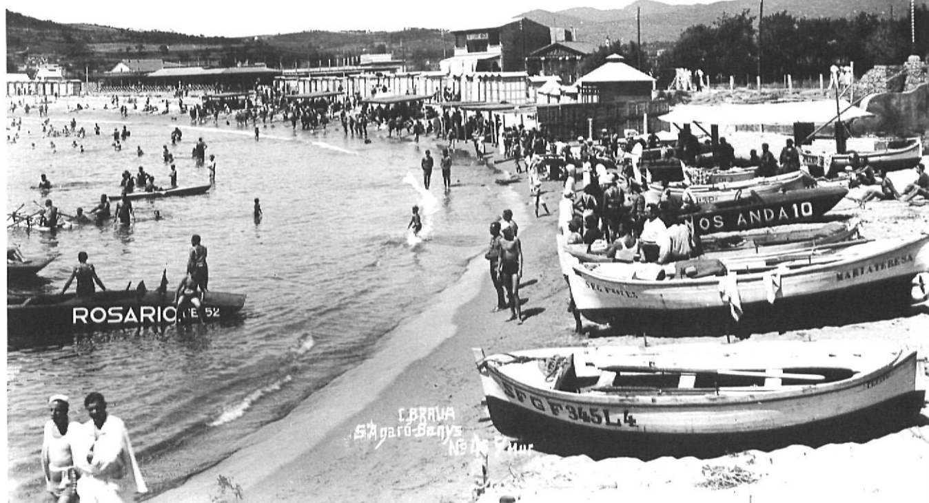
Banyes de S'Agaró als anys 20.