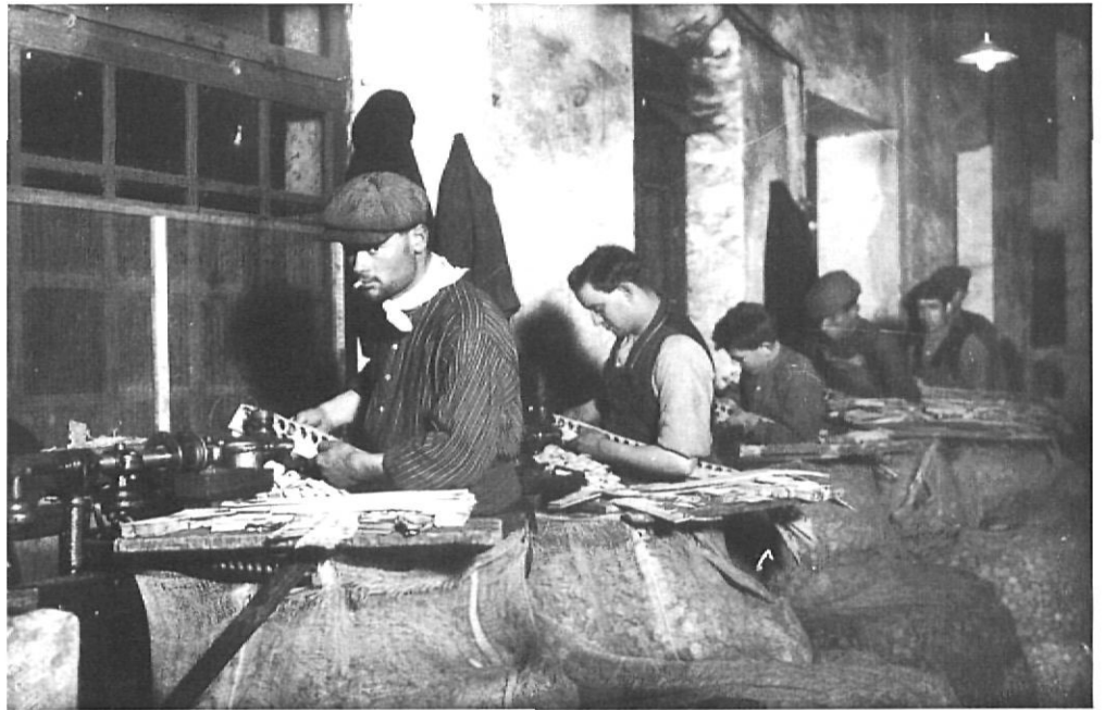
Taller d'una indústria surera.