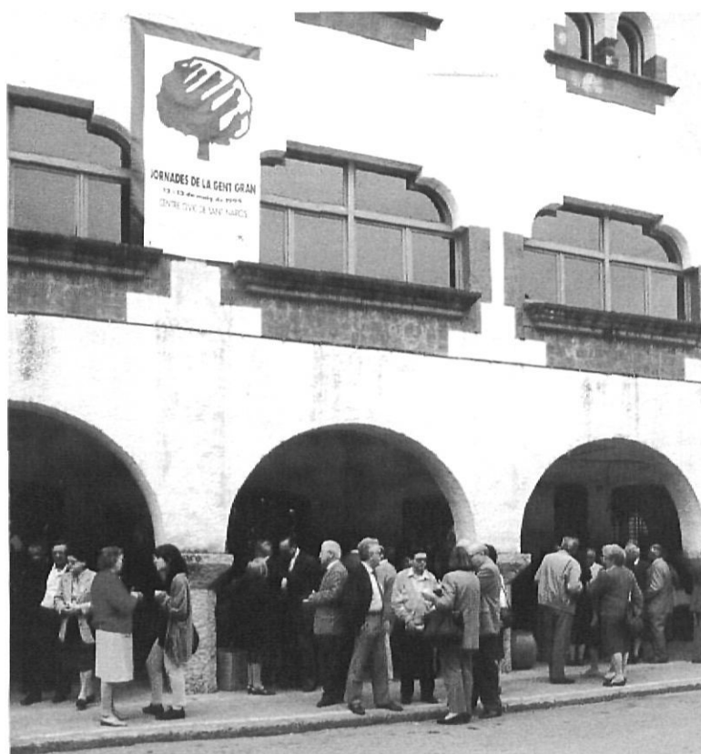
Assistents a les jornades de la Gent Gran de Girona.

SECOT. Sèniors espanyols per a la cooperació tècnica. Presta assessorament tècnic i professional a empreses o organismes amb dificultats; fan el servei uns experts jubilats que perllonguen així, però ara gratuïtament, la seva activitat natural amb l'afegit de