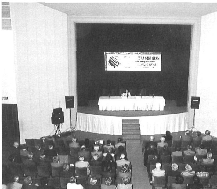
Una sessió de les Jornades.

l'experiència dels anys. Secot facilita consell, assessoria, anàlisi i estudi, però no fa mai la competència als professionals en actiu. L'entitat pertany a una xarxa europea de voluntariat econòmic.