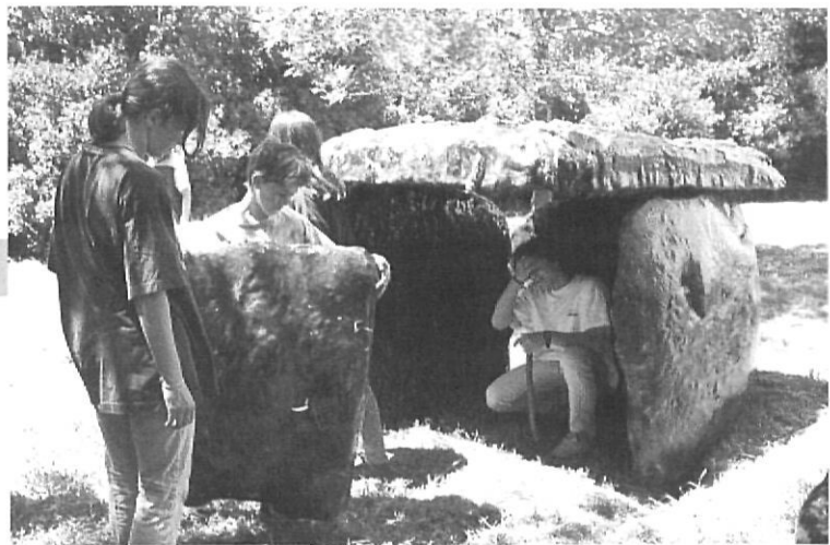
Procés de construcció d'un megàlit.

sobre roques dures, resseguint l'evolució temporal de les tècniques, i pràctiques de talla sobre còdol de riu i sílex. Un segon taller dedicat a les reproduccions d'aquestes eines afrontarà , a partir d'exemplars acabats, l'elaboració de conjunts heterogenis de materials que serviran a la fabricació d'un sol instrument: emmanegaments (fusta, resines naturals, pedra, os...) mànecs de fusta i part activa dels mànecs, cola i encolatge de la peça de sílex.