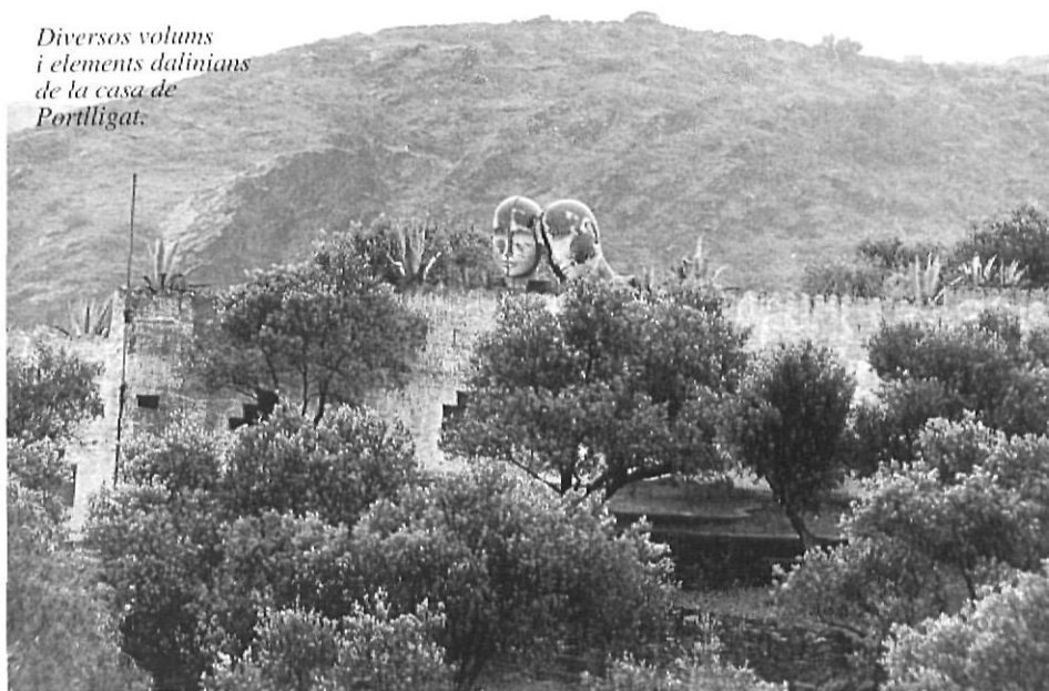
Diversos volums i elements dalinians de la casa de Portlligat.

Aquesta agrupació de diferents volums, amb teulats i parets a diferents nivells que ocupen un ampli espai situat a la banda esquerra del torrent, mantenen un estricte respecte per les formes i colors