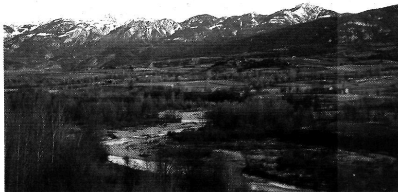
Els paisatges naturals són un dels principals recursos pel turisme rural i l'ecoturisme. La plana de la Cerdanya, i al fons, la serra del Cadí.

E l paper de l'administració autònoma més important en suport del turisme rural és a través de la regulació de les diferents modalitats i l'aplicació de diversos ajuts.