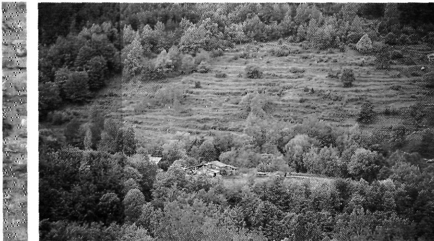
Els paisatges humanitzats, fruit de la interrelació home-medi, són de gran valor i atractiu per a turisme rural. Paisatge del Vidranès prop de Vallfogona.