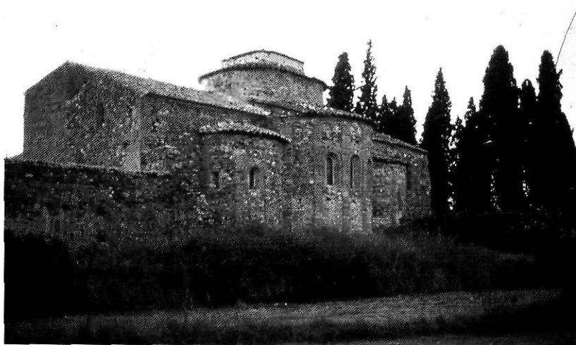
L'art romànic és un important patrimoni cultural existent a les comarques de Girona. Monestir de Sant Miquel de Cruïlles.

• a l'Alt Empordà la dinamització de sis municipis del massís de les Salines amb la constitució d'una associació,