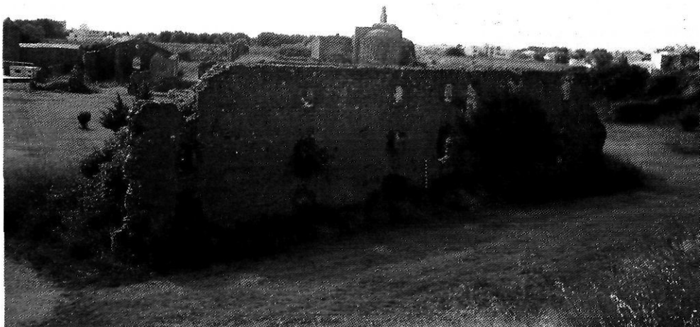
Vista d'una de les casernes des del terraplè de la cortina compresa entre el baluards de Sant Jaume i Santa Maria.