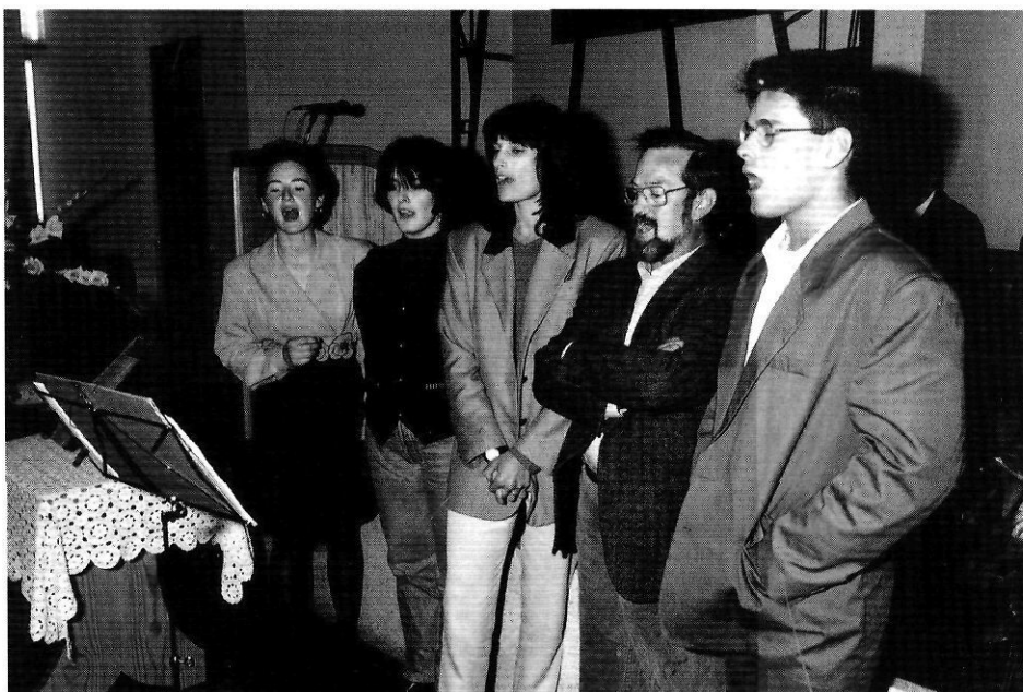
La litúrgia dels protestants sempre és acompanyada dels cants.

l'església de Badalona autoritzà els germans de Girona a constituir-se en església pròpia i independent, fet que va materialitzar-se el dia 7 de maig d'aquell any.