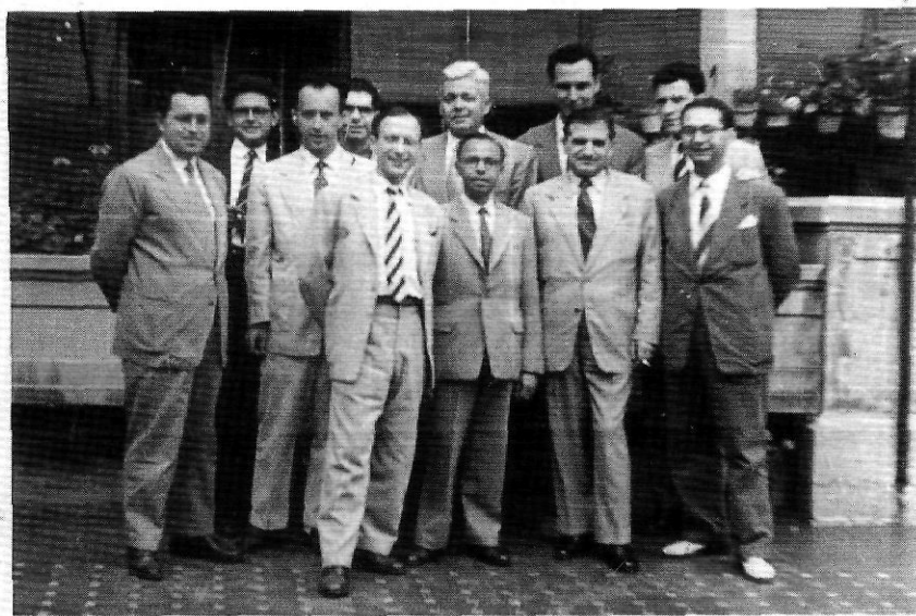
Reglà amb un grup d'historiadors presidits per Vicens Vives (1955).

Però l'esforç dialèctic-assimilatori de Reglà es féu sentir especialment des del 1968 enfront de les sempiternes resistències que hi trobà. La distància entre allò que es desitjava i allò que era possible esdevenia abismal i s'anava palesant la inutilitat del vo-