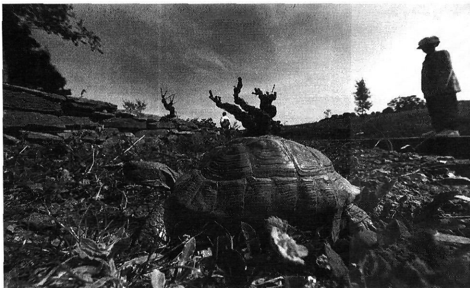
Una tortuga, al Centre de Reproducció de l'Albera.

alliberar-se 100 exemplars anualment. L'establiment funciona també com a punt d'acolliment de tortugues d'altres espècies cedides o decomissades, amb la intenció que no es deixin a qualsevol lloc i puguin hibridar-se amb l'ecotipus del Pirineu Oriental. Una altra tasca consisteix en facilitar l'observació i l'estudi a qualsevol visitant o investigador. Per aquest motiu, el centre té una reproducció dels ecosistemes més representatius de la zona, en els quals hi ha una mostra de les diferents espècies de rèptils i amfibis que hi habiten.