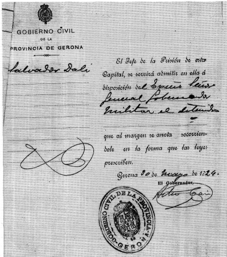
Els oficis relatius a la presó i a la llibertat de Dalí.

D'altra banda, tanmateix, el mateix Dalí va escriure: «Aquest període d'empresonament m'agradà qui-sap-lo. Em trobava, és clar, entre els presos polítics; amics, correligionaris i parents ens omplien de regals. Cada tarda beviem xampany del país, molt dolent. Havia reprès la meua feina a la Torre de Babel i revivia l'experiència de Madrid traient conseqüències filosòfiques de cada incident i cada detall. Era feliç, perquè acabava de redescobrir el paisatge del pla de l'Empordà, i mirant aquest paisatge entre els barrots de la presó de Girona em vaig adonar que finalment havia aconseguit envellir una mica. Això era tot el que desitjava, i era tot que uns quants dies havia desitjat arrencar i espremer de la meua experiència a Madrid. Era bonic allò de sentir-se una mica més vell i trobar-se en una «presó de debò» per primera vegada. I finalment, mentre durés tot allò, em seria possible d'alleujar la tensió del meu esperit» (13).