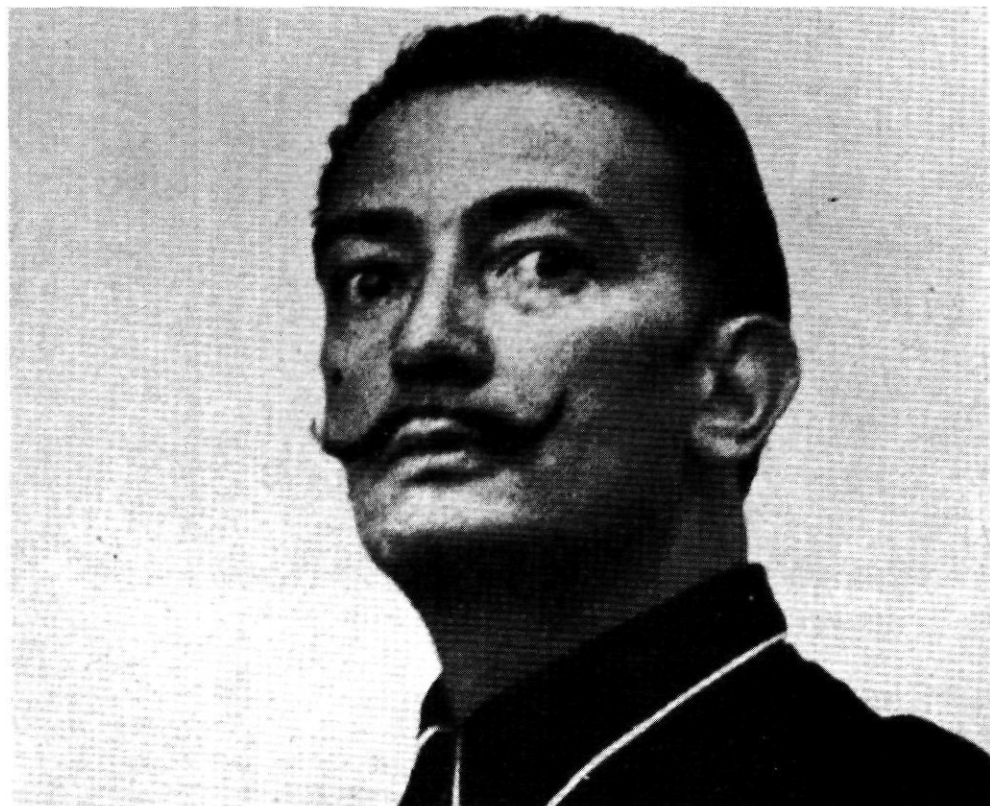
Dues imatges de Dalí en els anys de joventut