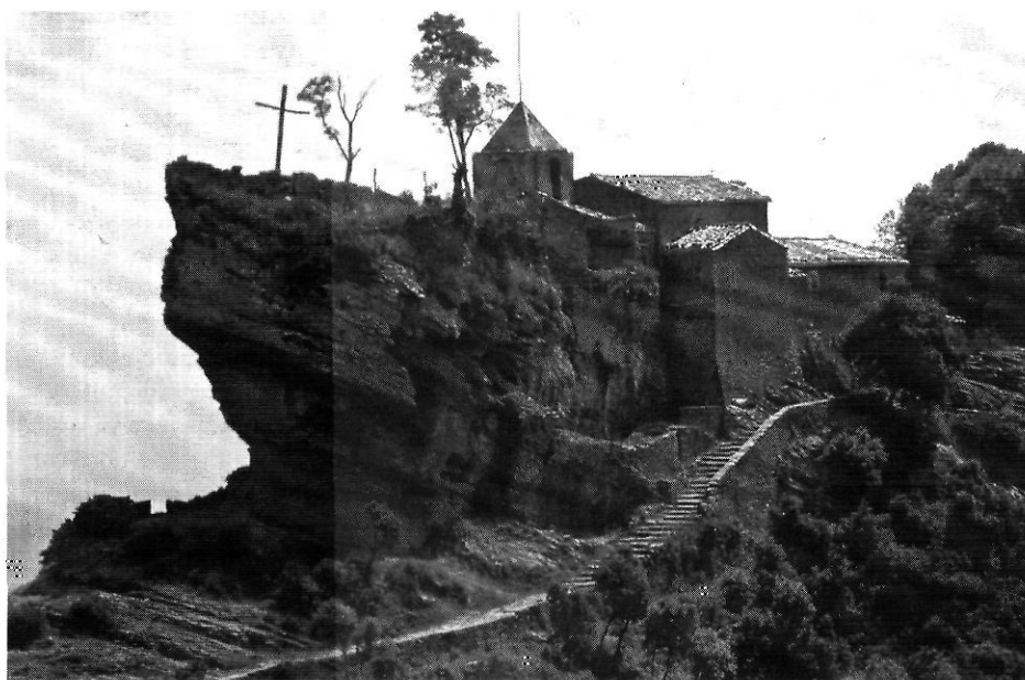
El santuari de Rocacorba.

Aquesta pedagogia dels noms s'ha d'emmarcar en la cultura bàsica. No voldria pas ser interpretat malament, però m'arrisco: avui la universitat, les universitats, ens estan produint grans quantitats i qualitats de