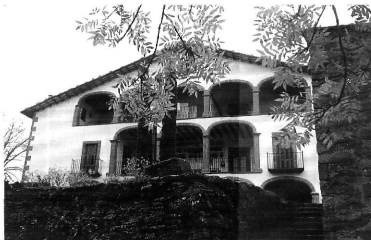
Corriol al Collsacabra. A sota, el Far.

llicenciatures i doctorats en totes les branques del saber, però potser ara ens faltaran divulgadors ; és a dir persones que sàpiguen fer baixar el to del pedestal i engrunin els temes de cultura general. La geografia amb què ens topem cada diumenge, a cada sortida, és un d'aquests temes, ben populars. Ara cal fer una pregona referència, amb desig d'interpel·lació, a les entitats excursionistes que des dels seus inicis, ja fa més de cent anys,