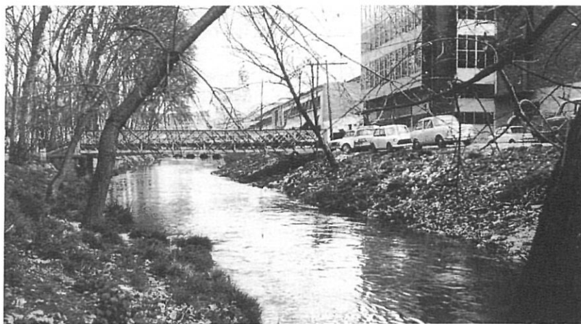
Antic traçat del riu Güell abans del seu desviament l'any 1969.

Girona ha estat històricament una ciutat molt castigada per les inundacions (Chia, 1861; Alberch i altres, 1982; Güell i Sorribas, 1991). La seva complexa hidrologia de superfície (quatre rius, el Ter, l'Onyar, el Güell i el Galligants, a més d'altres cursos menors d'aigua, travessen la ciutat) i la vulnerabilitat creixent al risc d'avingudes com a conseqüència del procés de progressiva i intensa ocupació de la plana d'inundació n'han estat les dues raons principals.