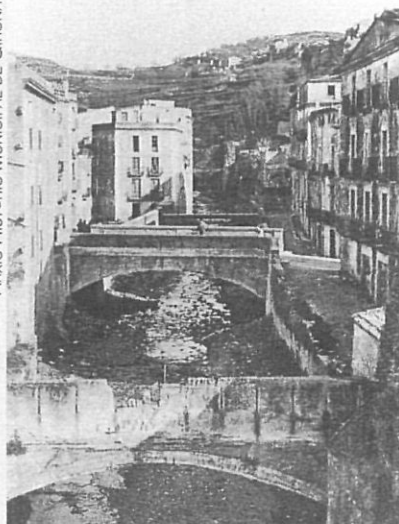
El Galligants al seu pas pel barri de Sant Pere i abans de construir-se la plataforma actual.

nins quant a futures avingudes que ha afavorit l'ocupació de les àrees tradicionalment exposades al risc i així, quan se superen els límits de seguretat permesos, els danys són cada vegada més elevats. Un excel·lent exemple ens el dona la inundació d'octubre de 1970 (VV.AA., 1970). Després d'haver-se realitzat importants obres hidràuliques a la dècada de 1960, espais altament susceptibles al risc d'inundacions (Sant Narcís, Santa Eugènia i el mateix nucli antic de la ciutat, principalment) experimenten un intens i desordenat creixement i seran els primers afectats quan l'any 1970 l'acció conjunta dels quatre rius inundi tres quartes parts de la ciutat, provocant danys que es valoraran en 500 milions de pessetes (Barceló i altres, 1989).