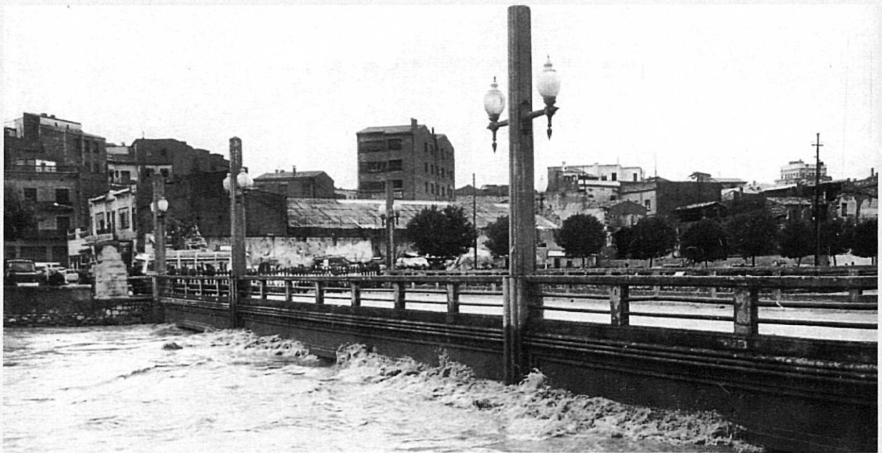
El pont de l'alferes Huarte va ser enderrocat després de l'aiguat de 1970 per haver-se convertit en un obstacle per al pas de l'Onyar.

la possibilitat d'utilitzar aquestes àrees (la Devesa) com a espais d'esbarjo i esport, però tenint en compte de protegir-les de l'acció de les aigües en cas de règim d'avingudes normals.