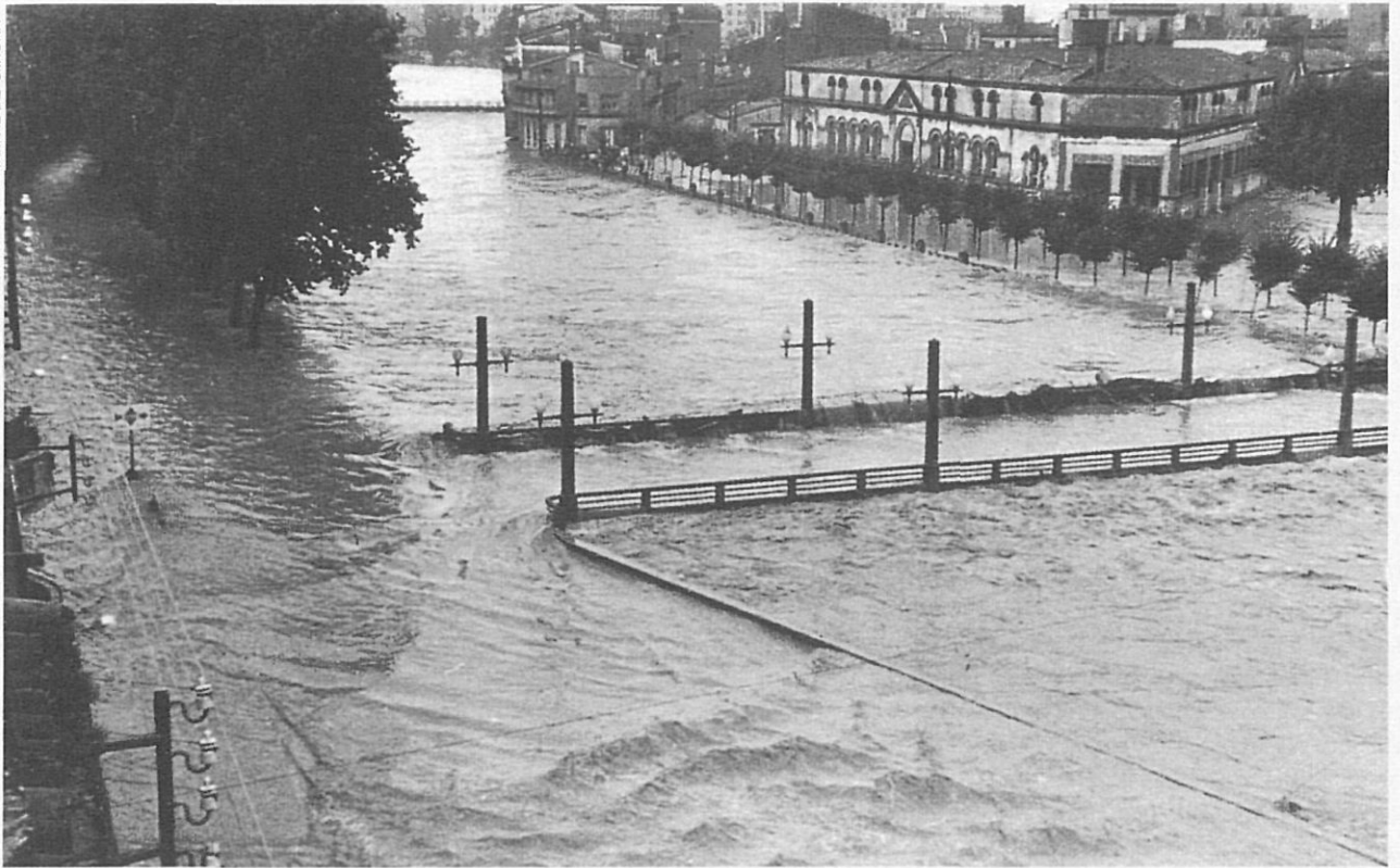
Aspecte de l'Onyar al pont de l'Alferes Huarte a la inundació de l'any 1962.

de la muralla així ho fa pensar. Altra-ment, Alberch i Aragó (1984, pàg. 62) constaten com «a partir de mitjan segle XIX es fan obres d'aixecament del nivell dels carrers de la part baixa de la ciutat per tal d'allunyar el perill del riu; la mostra més vistenta d'aquest procés és la reforma de l'antiga plaça de les Cols i l'enderrocament dels portals d'en Vila i de l'Areny per on l'aigua entra amb més facilitat». També, a mitjan segle, l'ajuntament recomana aixecar el nivell dels soterranis dels edificis llin-dants al riu Onyar, malgrat que molts propietaris no en fan cas i continuen aprofitant aquests soterranis per magatzem o altres dependències ( Manual d'Acords , 1962, f. 226).