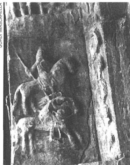
Els relleus de la façana acusen el pas del temps. La fotografia de l'esquerra és de 1933; la de la dreta, de 1993.

tasca no era pas closa amb plena dignitat, alhora que reclamava el compromís de tots els presents per retrobar-se el juliol d'aquest 1993, amb les fites definitivament assolides.