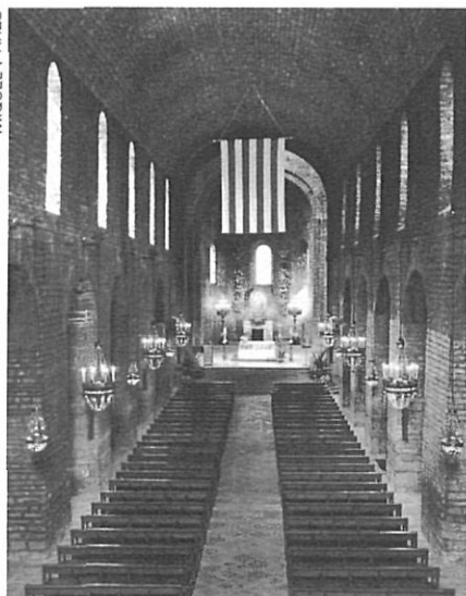
Interior de la basílica de Santa Maria de Ripoll.