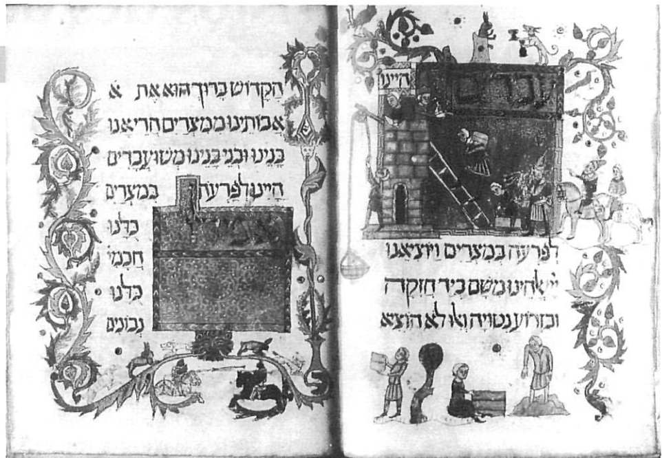
L'obra del segle XIII recull les plegàries jueves de la litúrgia de Pasqua.