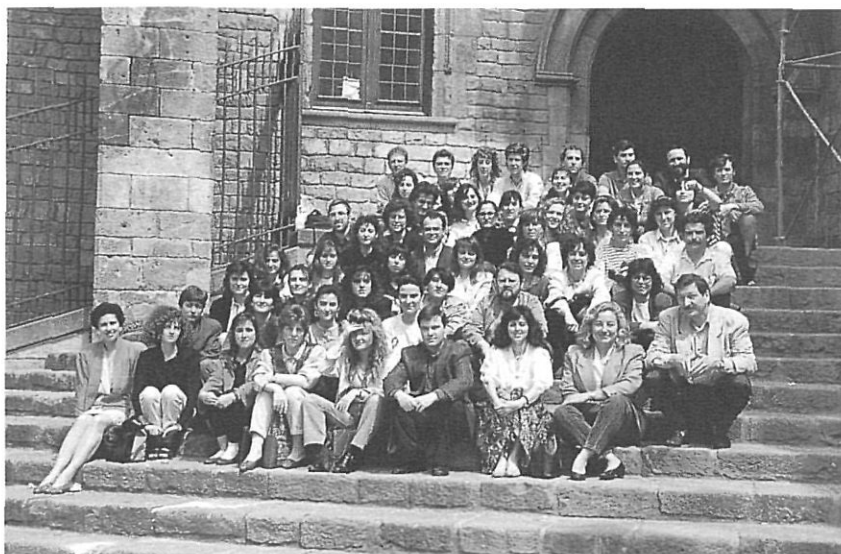
Primera promoció d'alumnes del Curs bàsic postuniversitari de formació en patrimoni (1991) amb l'equip tècnic de l'Escola del Patrimoni de Barcelona.

El que dóna coherència a la protecció de determinats espais naturals és precisament la seva concepció com a patrimoni col·lectiu, l'assumpció per part de la societat de la necessitat d'aquesta protecció, fonamentalment, per causa de dos criteris: d'una banda perquè ja és majoritàriament acceptat el fet que la preservació d'una propor-