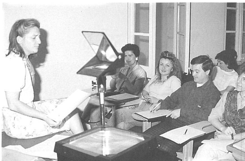
Impartició de cursos de l'Escola del Patrimoni a les aules del Museu d'Història de la ciutat de Barcelona.

Més difícil es fa definir l'adjectiu natural. Si parlem d'espais naturals o de medi natural per referir-nos, en sentit estricte, com ho fa el geògraf Olivier Dollfus, a aquells indrets que no han estat modificats o alterats per l'home, és a dir a aquells que resten fora de l' oïkumene , l'espai utilitzat per l'home, això restringeix tant el seu ús que aquest resta limi-