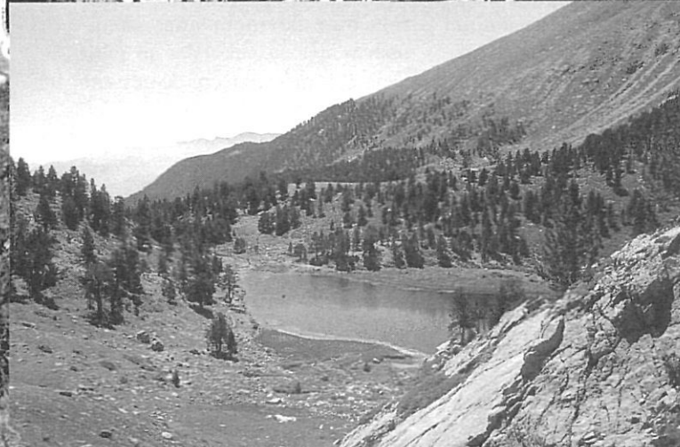
Els llacs de la Cerdanya, part integrant del paisatge pirinenc.