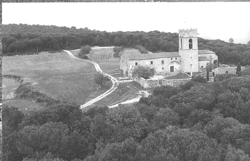
Santuari del Corredor, envoltat de pinèdes de pi pinyer: un paisatge cultural.