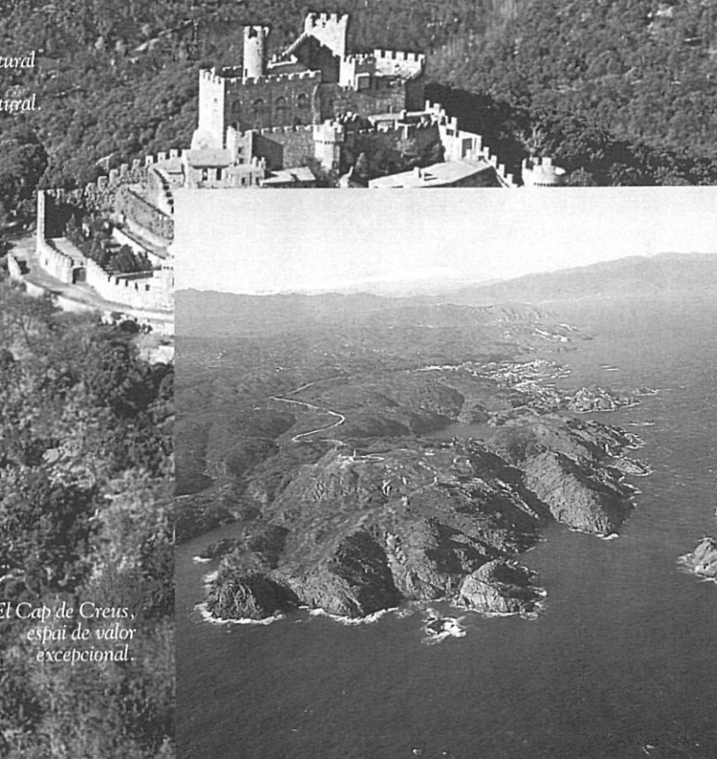
El Cap de Creus, espai de valor excepcional.