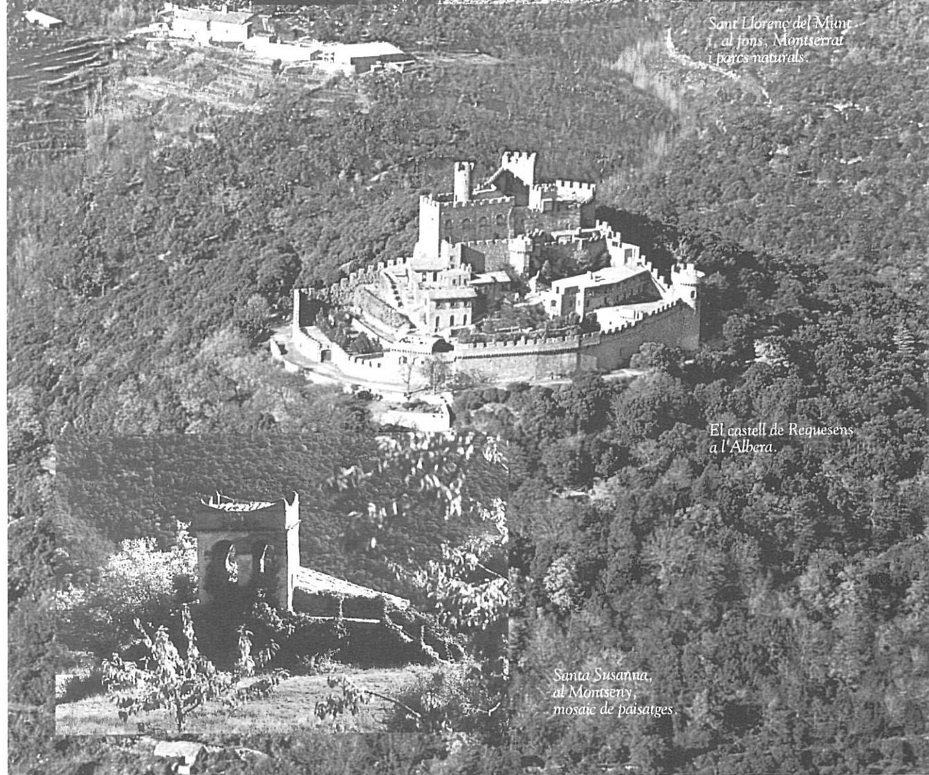
El castell de Requesens a l'Albera.