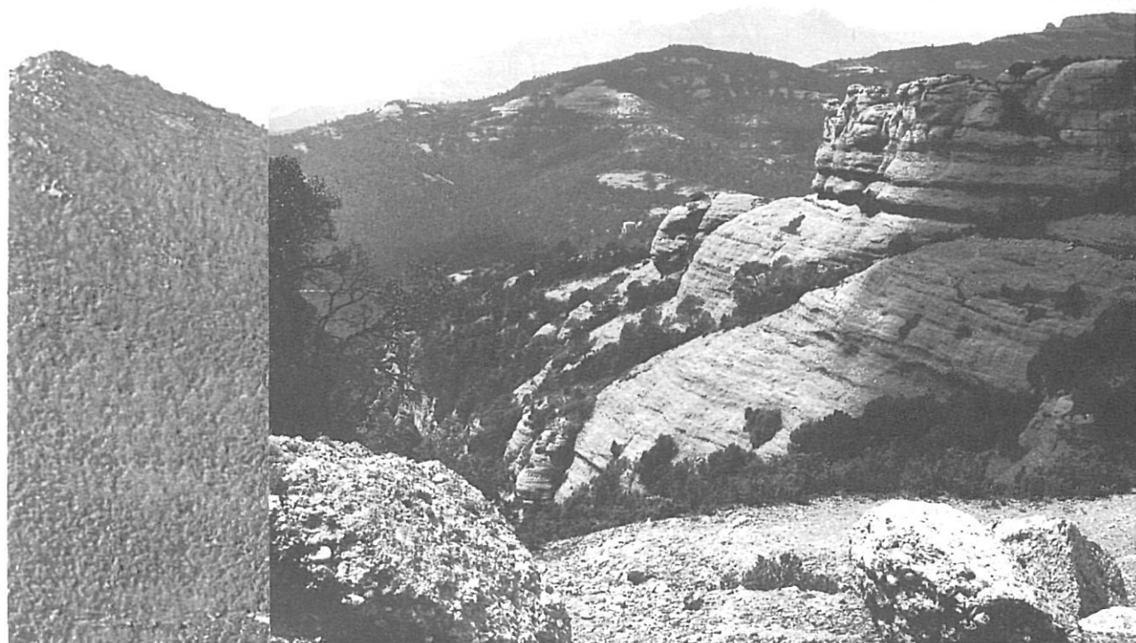
Sant Llorenç del Munt, al fons, Montserrat i parcs naturals.