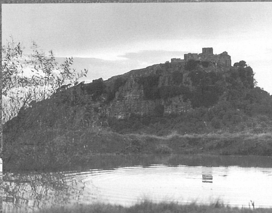
Tagamanent, patrimoni cultural restaurat dins d'un espai natural.