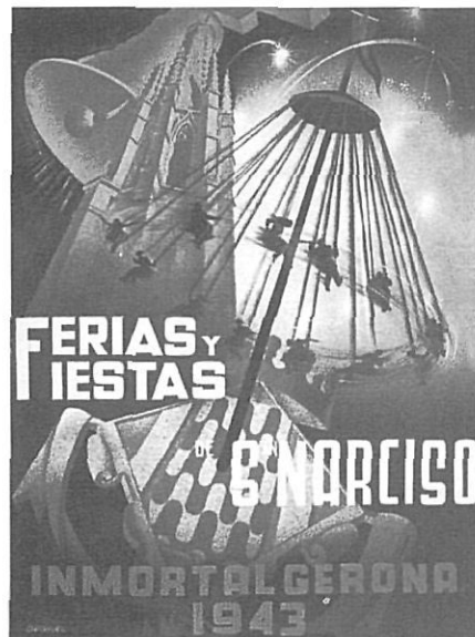
Cartell de les Fires de 1943, obra característica d'Orihuel.