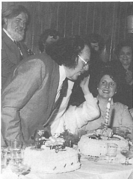
Orihuel apaga l'espelma del pastís el dia del seu vuitantè aniversari.