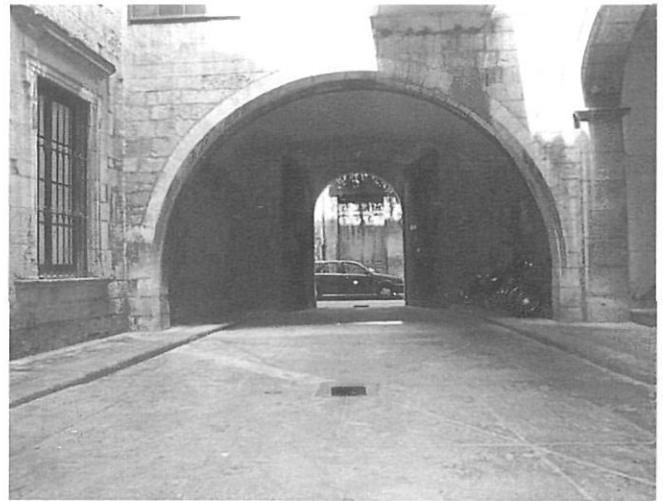
Dues imatges del pati d'entrada al casal dels Sarriera.