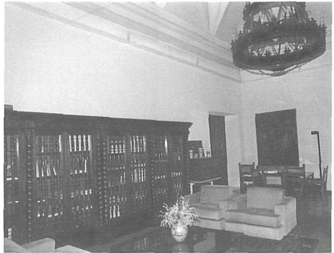
El pati interior i una de les sales de la planta noble de l'edifici.