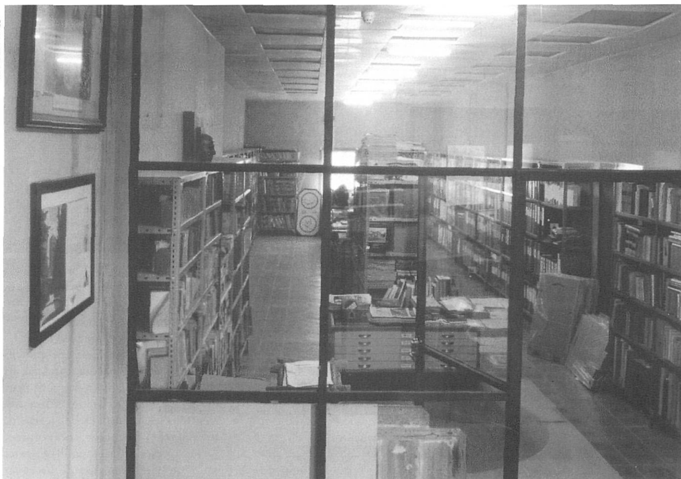
L'arxiu en el seu actual emplaçament. La realitat d'un vell projecte.

trials de Catalunya, on llançava la idea, per ell sovint exposada, del Ripollès del segle XVII com a bressol de la industrialització del país. El llibre es publicava al final de 1990 en una esplèndida edició particular.