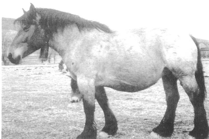
«Presenta les cames curtes, fortes i robustes; a voltes semblen massa petites per a un cavall tan gros».

de cavall on podem observar: un perfil convex; una arcada orbitària gran, ulls grans, orelles curtes, agudes i dretes i crina en serreta, galtes poc carregades i boca grossa; coll, un poc arquejat i que es va aprimant fins al cap; espatlles, amples; pit, ample i eixit enfora; i dors, curt i pla.