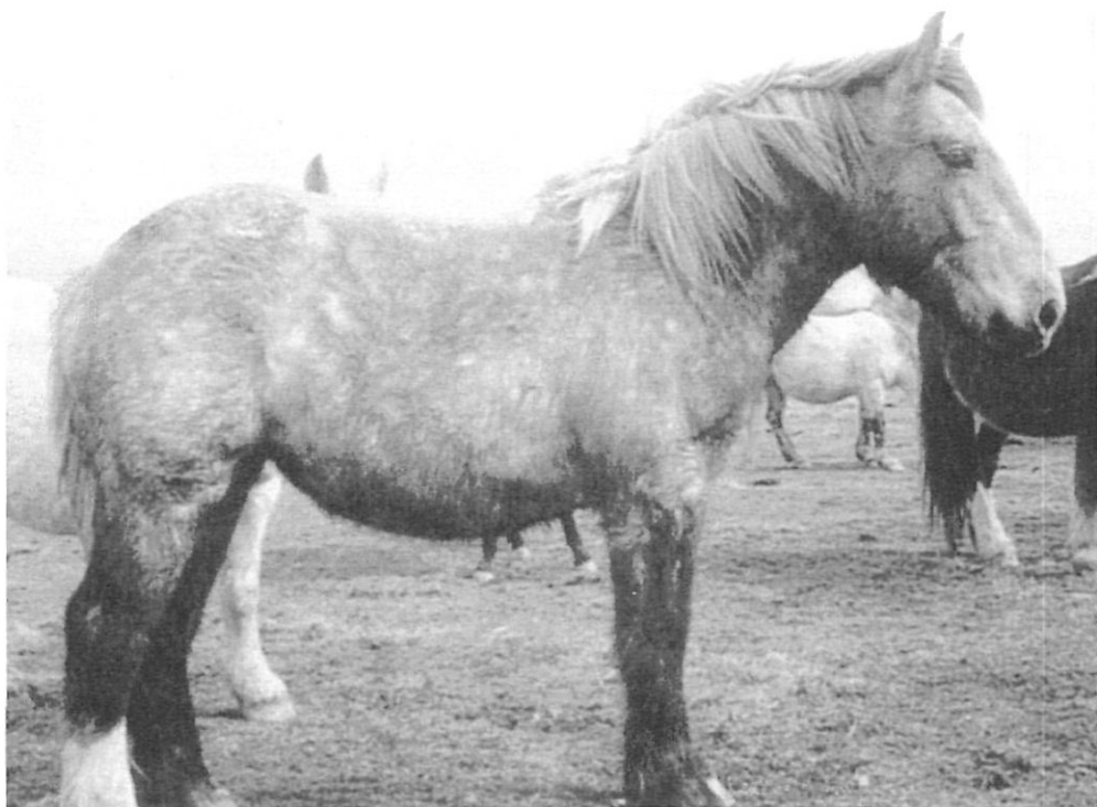
"El fet que aquest cavall visqui gran part de l'any a la natura és la causa de la seva robustesa".