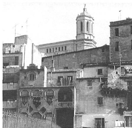
En la capitalitat de Girona hi conflueixen diversos nivells de jerarquia.