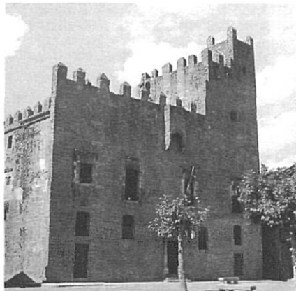
La Bisbal, entre la capacitat d'atracció de Girona i el dinamisme del litoral.