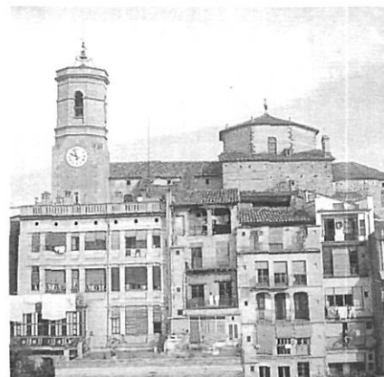
L'aïllament del conjunt de la Garrotxa ha consolidat la centralitat d'Olot.

litorals baixempordaneses i selvatanes i les respectives capitals comarcals, la Bisbal i Santa Coloma de Farners, en són un bon testimoni.