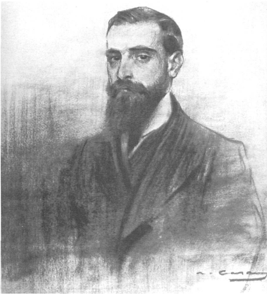
Francesc Cambó vist per Ramon Casas.