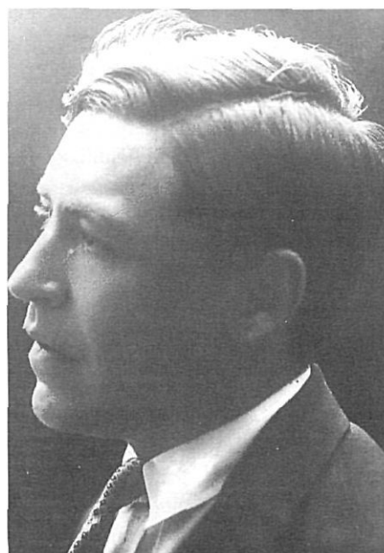
El Pla dels anys vint.

ment anarquista es trobaria encara en la fase primitiva i sentimental, dominada per un literaturisme passional i truculent . Concretat a Catalunya, l'anarquisme s'hauria manifestat per una gran improductivitat i per la demagògica d'uns dirigents obrers d'extracció forastera.