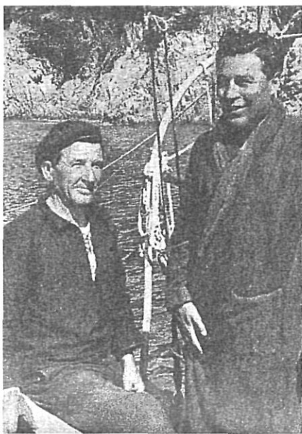
Després d'un bany a Aigua-xellida.